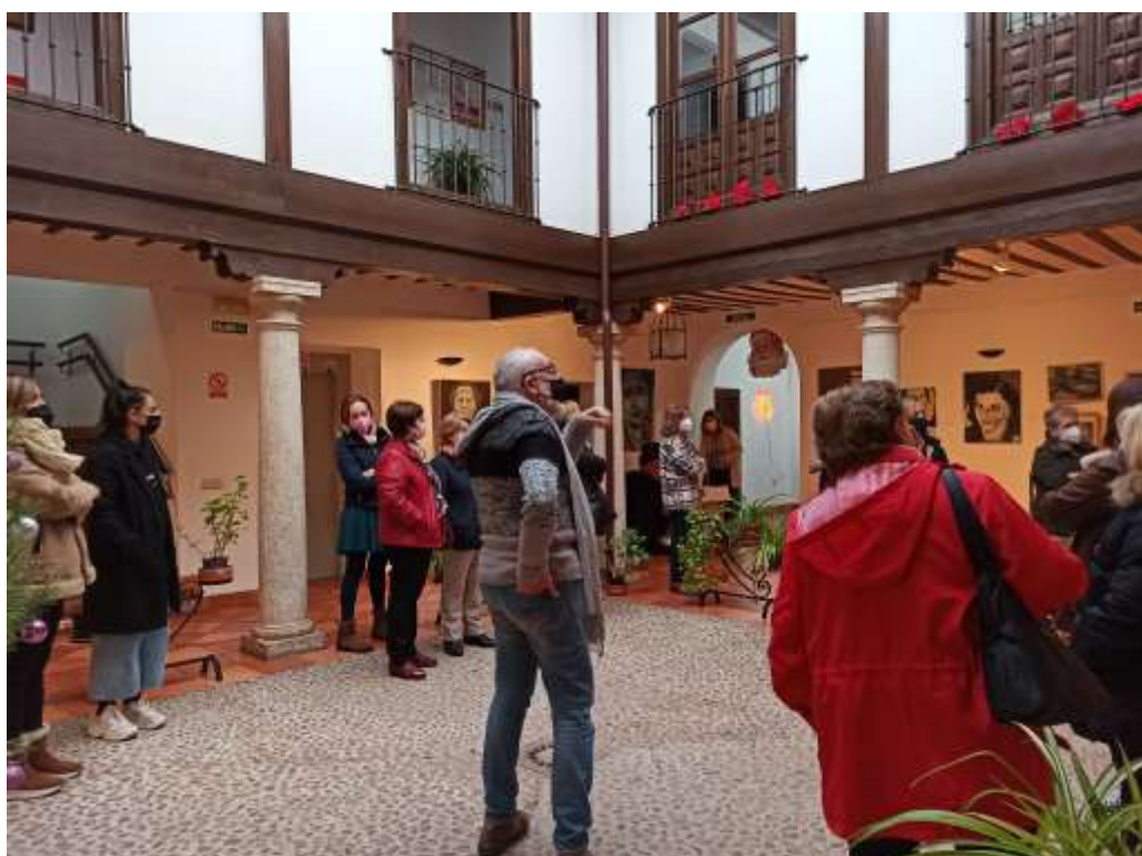
Imagen de la Visita guiada a la Exposición “Madres y Santas”

Para la visita guiada se formó un grupo de 20 mujeres entre las que participaron participantes de las Asociaciones de Mujeres, usuarias del Centro de la Mujer, equipo profesional del Centro y Concejala de Igualdad del Ayuntamiento.