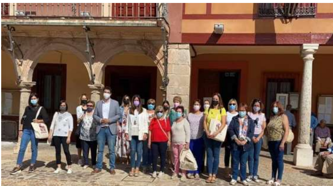
*imagen de las personas que asistieron a la firma del Convenio.

A la misma, junto a los/as empresarias o representantes de las empresas que firmaban el Convenio, acudieron representantes políticos, como la Directora del Instituto de la Mujer, la Delegada Provincial de Igualdad de Ciudad Real, el Alcalde de La Solana y la Concejala de Igualdad. También asistieron el equipo profesional del Centro de la Mujer y representantes de Asociaciones de mujeres de la localidad.