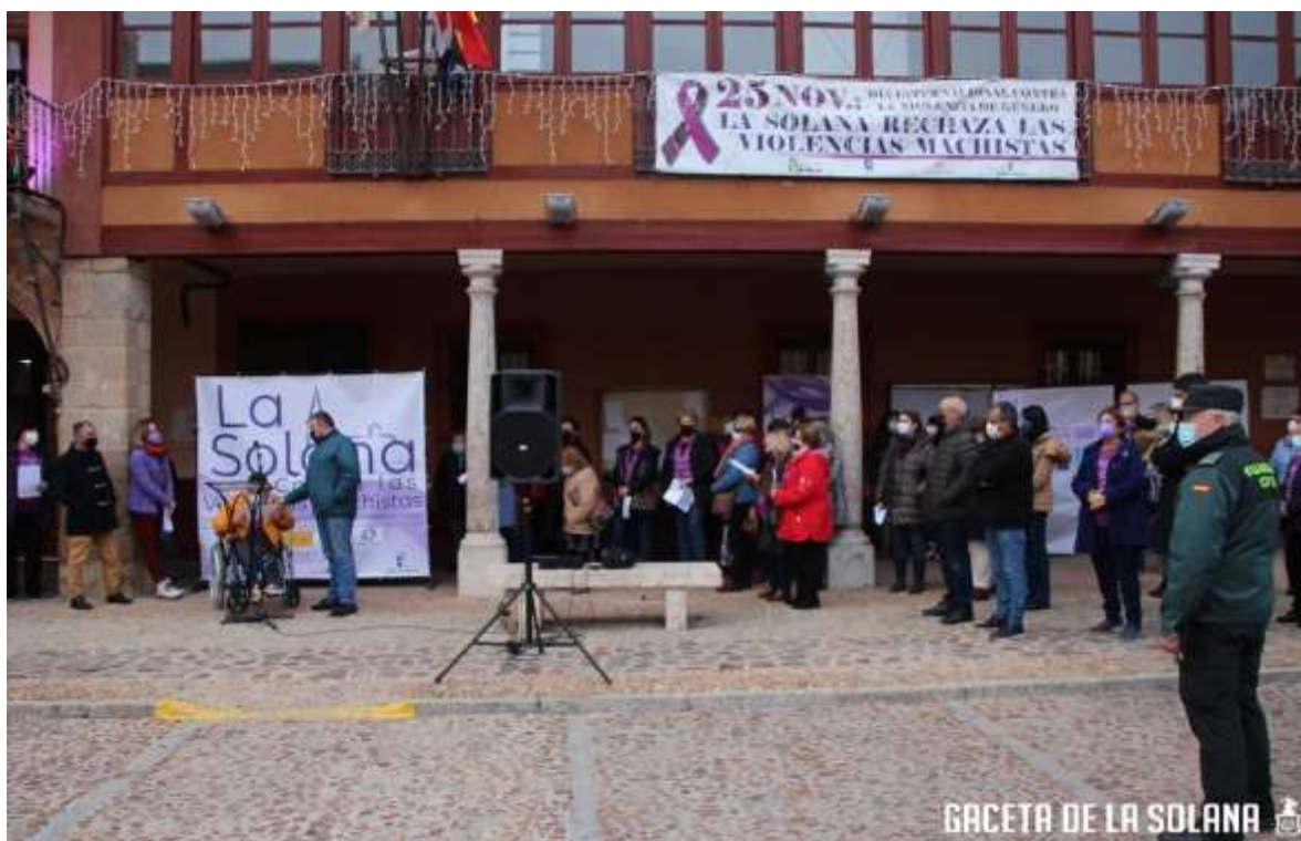
Imágenes de la Concentración contra la violencia de género.

La pancarta conmemorativa con el lema "La Solana contra las violencias Machistas" expuesta en el Balcón del Consistorio junto a la iluminación en violenta del edificio, son otros gestos simbólicos que completaron este Acto de sensibilización ciudadana.