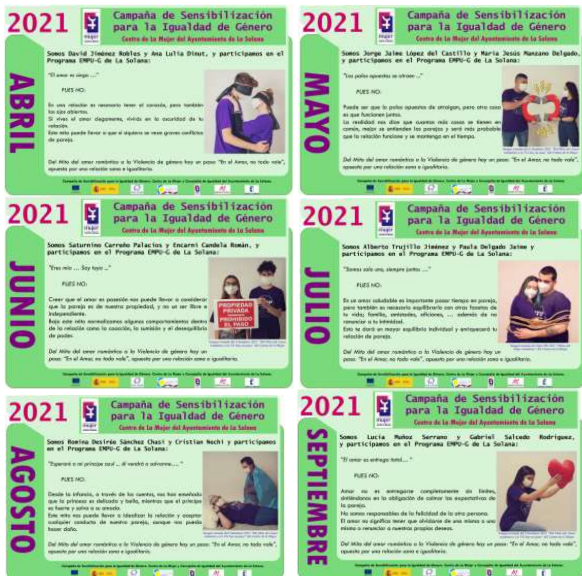
Imagen de las Cuñas que componen la Campaña de Sensibilización 2021

Del Mito del amor romántico a la Violencia de género hay un paso: "En el Amor, no todo vale", apuesta por una relación sana e igualitaria.