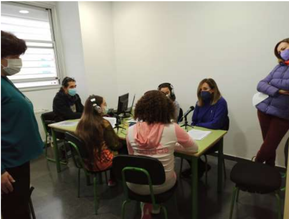
* Imagen del desarrollo de la entrevista