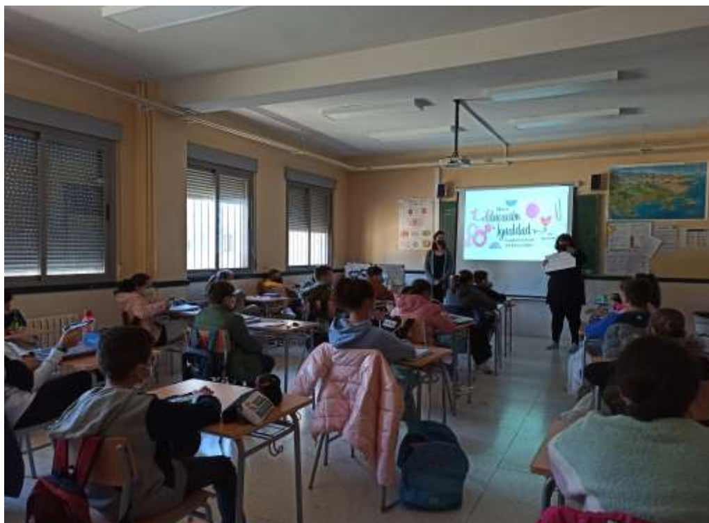
Imagen de uno de los Talleres