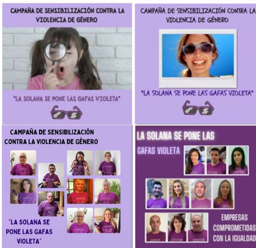
Imágenes de los vídeos animados de la Campaña "La Solana se pone las gafas violeta"

Muchas de estas personas aparecieron con estos materiales en los videos animados que realizamos en redes sociales.