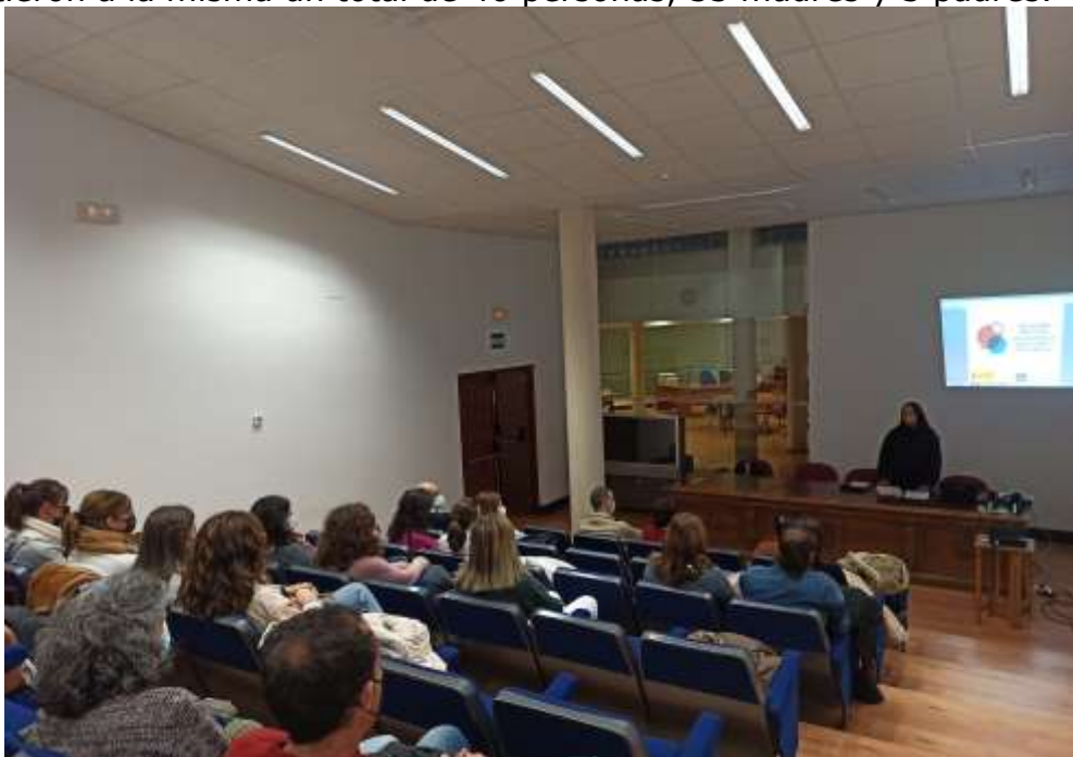
Imagen de la Charla de la Asociación Punto Omega con las Familias

Asistieron a la misma un total de 40 personas, 33 madres y 3 padres.