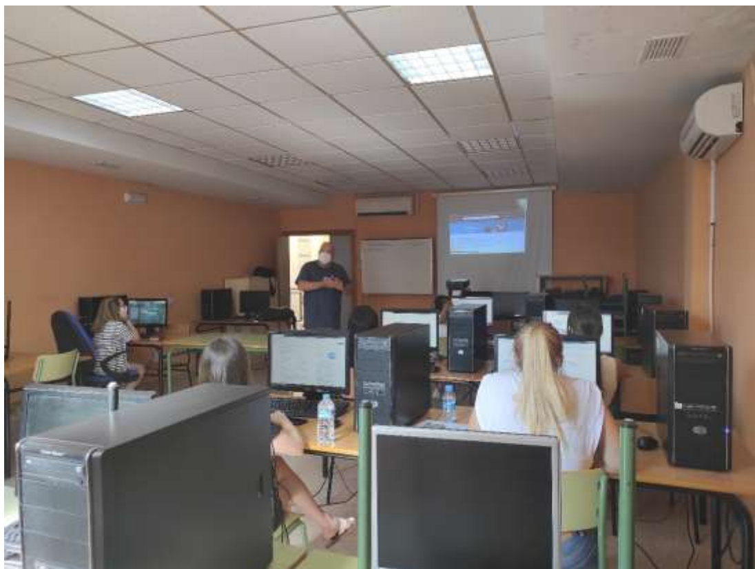
Imagen del Taller