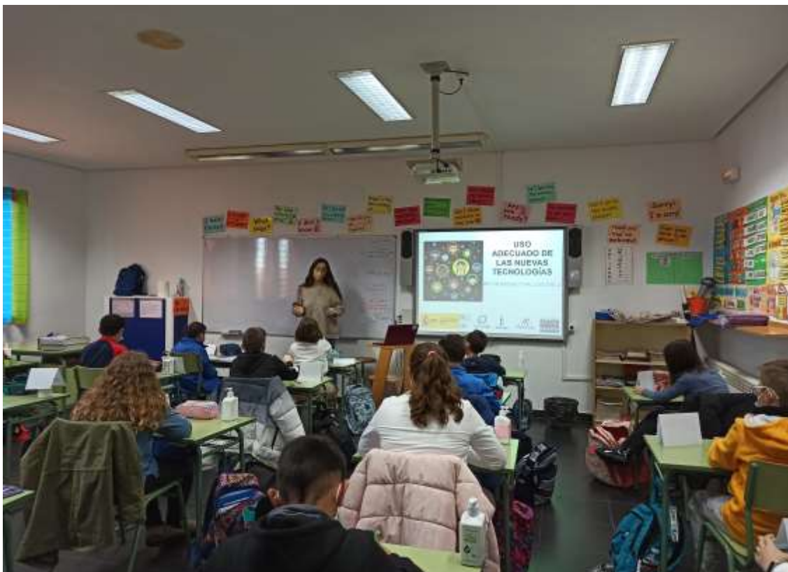
Imagen de los Talleres on line desarrollados en los colegios con 6º de Primaria.

Todos los Talleres se realizaron los días 23 y 25 de noviembre de 2021, impartándose por varios/as Técnicos/as de la Asociación de forma simultánea.