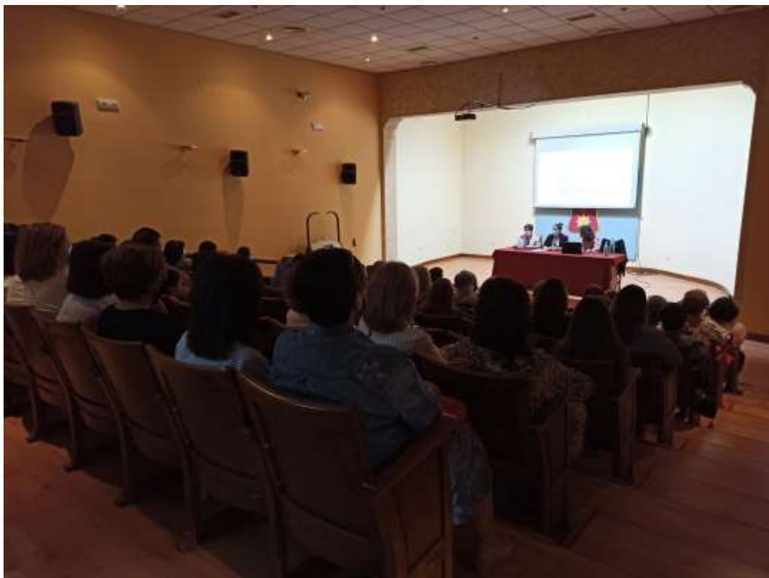
* Imagen del Acto