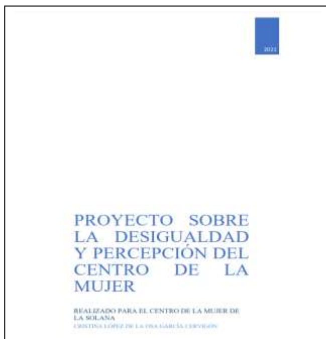
* Imagen portada del Estudio