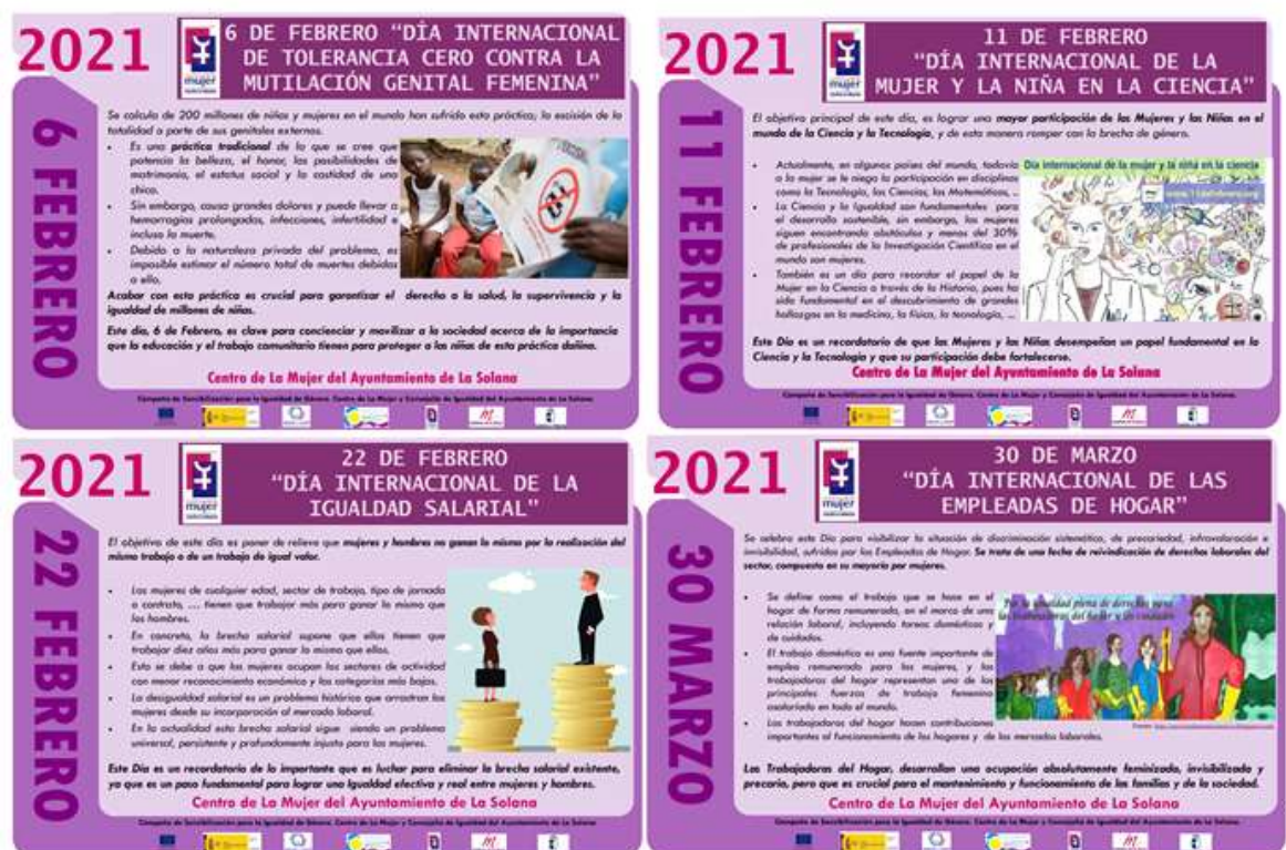
* Imágenes de los carteles difundidos