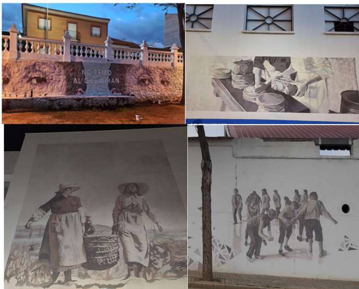
Imágenes de los Murales urbanos realizados