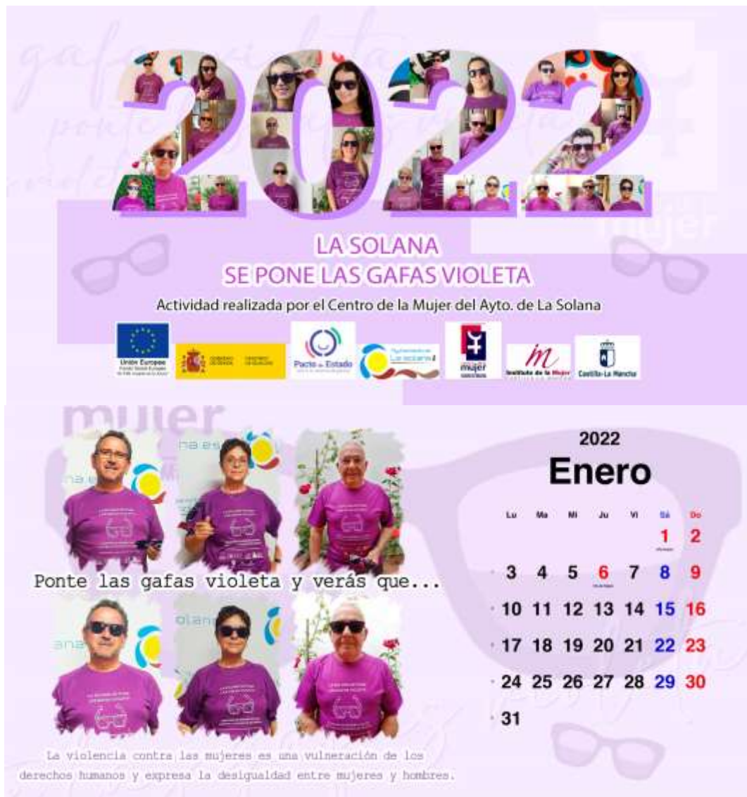
Imágenes del Calendario.