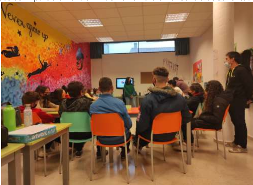
Imagen de uno de los Talleres impartidos en el Programa Empug-e

Ambos se impartieron el día 24 de noviembre en el Centro de Juventud.