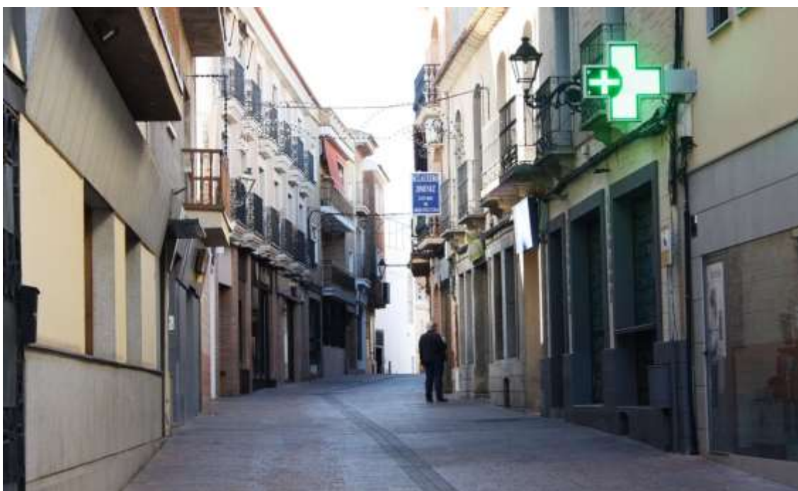
*Imagen de calle de la localidad con diversos comercios