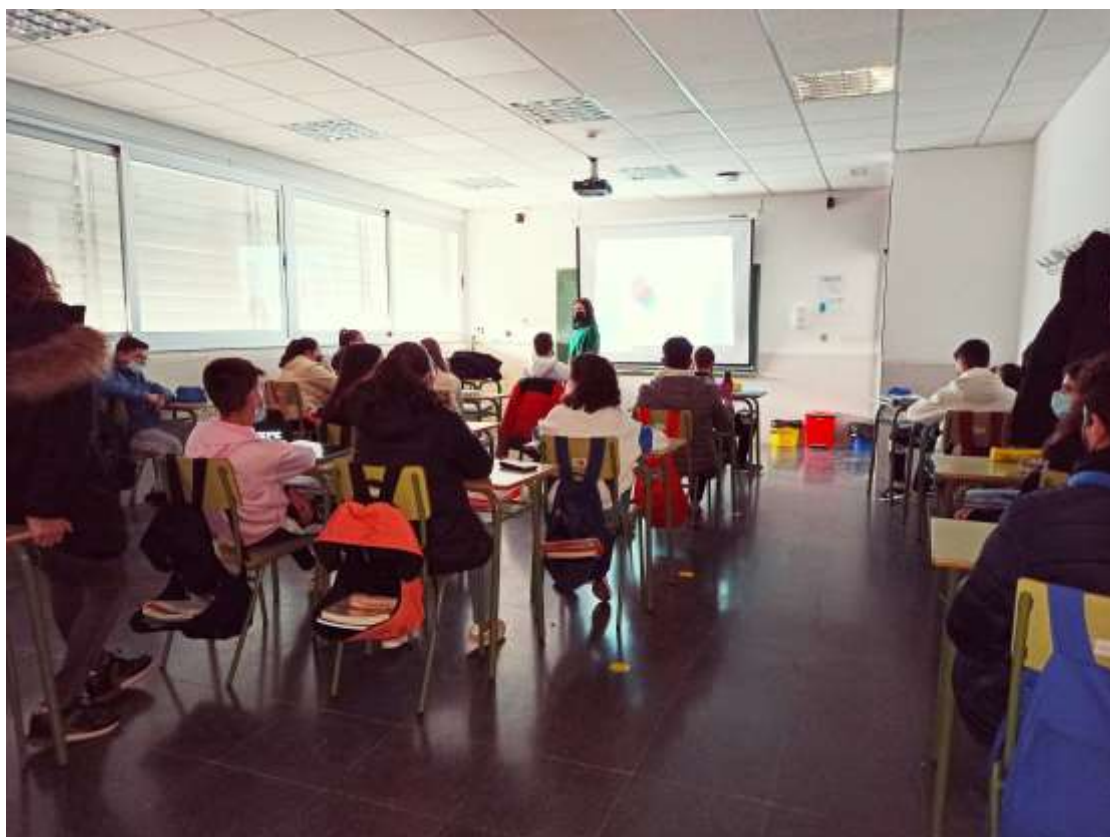
Imagen de uno de los Talleres impartidos en el IES Clara Campoamor

Los talleres se realizaron de manera presencial y se dirigieron al alumnado de 3º de E.S.O. de los dos IES de La Solana. Cada taller tuvo una duración de dos clases lectivas consecutivas y se desarrollaron los días 18, 24 y 29 de noviembre de 2021.