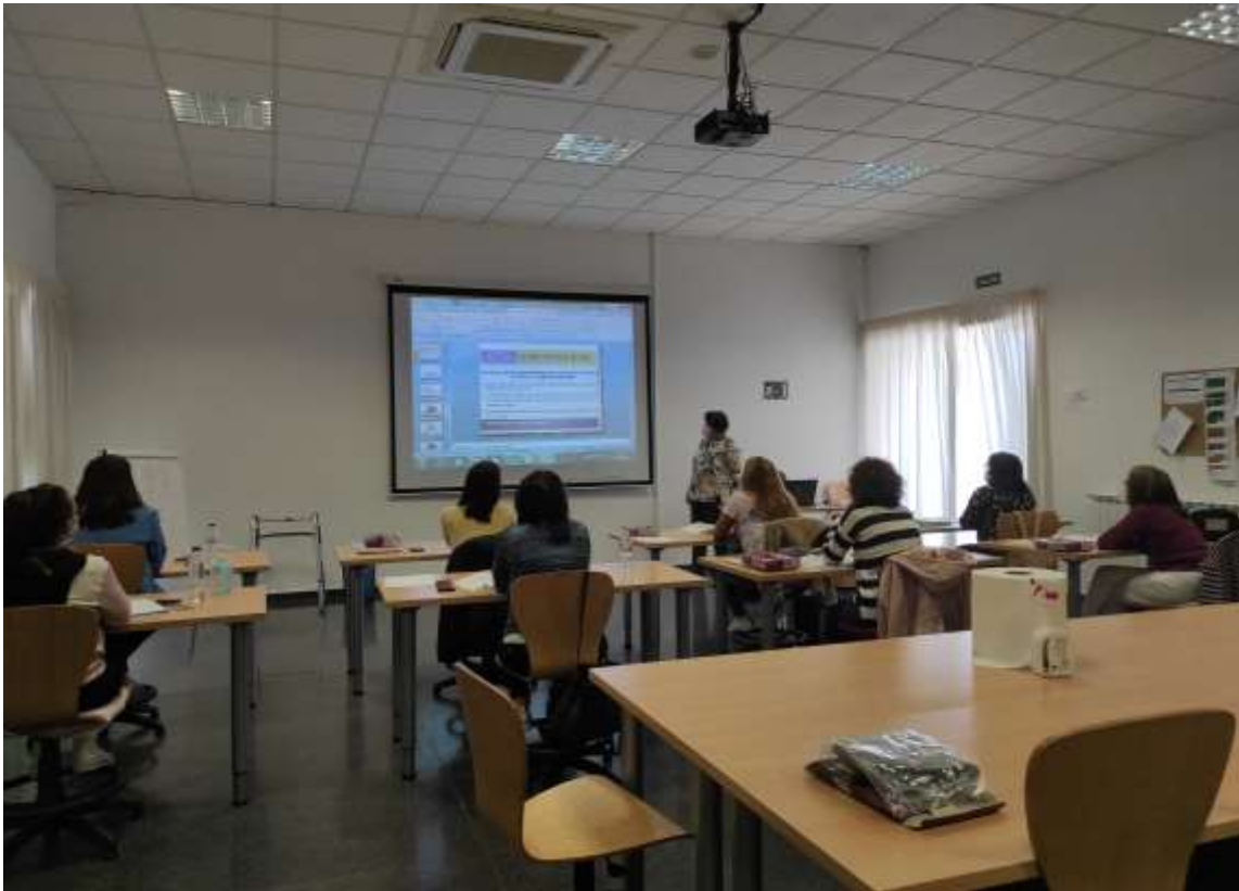
*imagen del Taller