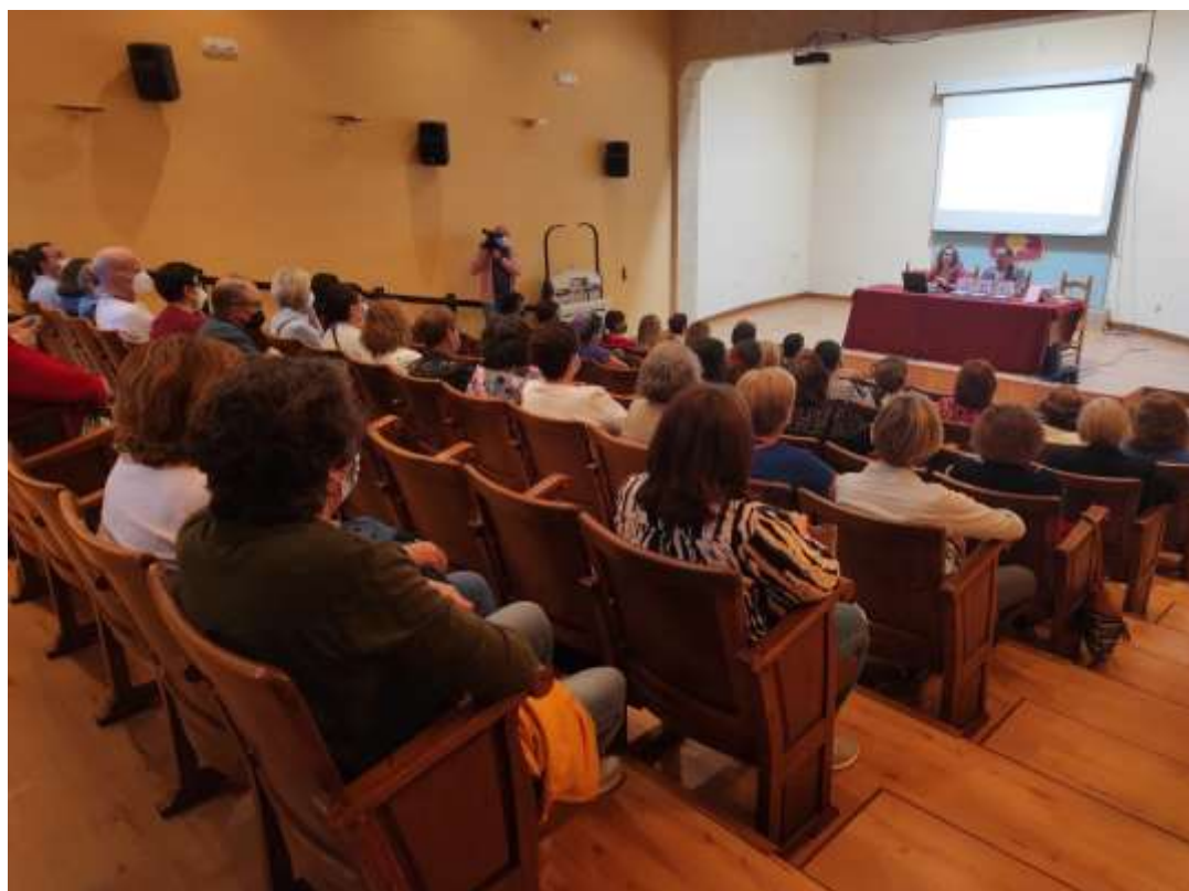
Imagen de la Charla impartida por la A. Mamachama

- Reportaje "Nuevas Narrativas" : basado en la construcción de una cultura basada en la igualdad, la solidaridad, el cuidado y el apoyo mutuo. Se reflexionó sobre la construcción de nuevas narrativas que nos posibiliten cambiar la cultura actual y cómo utilizar el arte como herramienta de transformación. En el vídeo pudimos escuchar testimonios en torno a estas cuestiones.