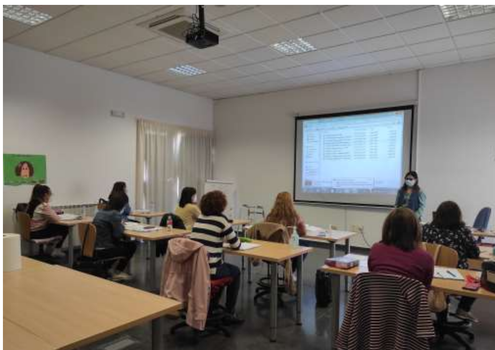
Imagen del Taller “Vivir sin Violencia de Género” impartido al Taller de Empleo