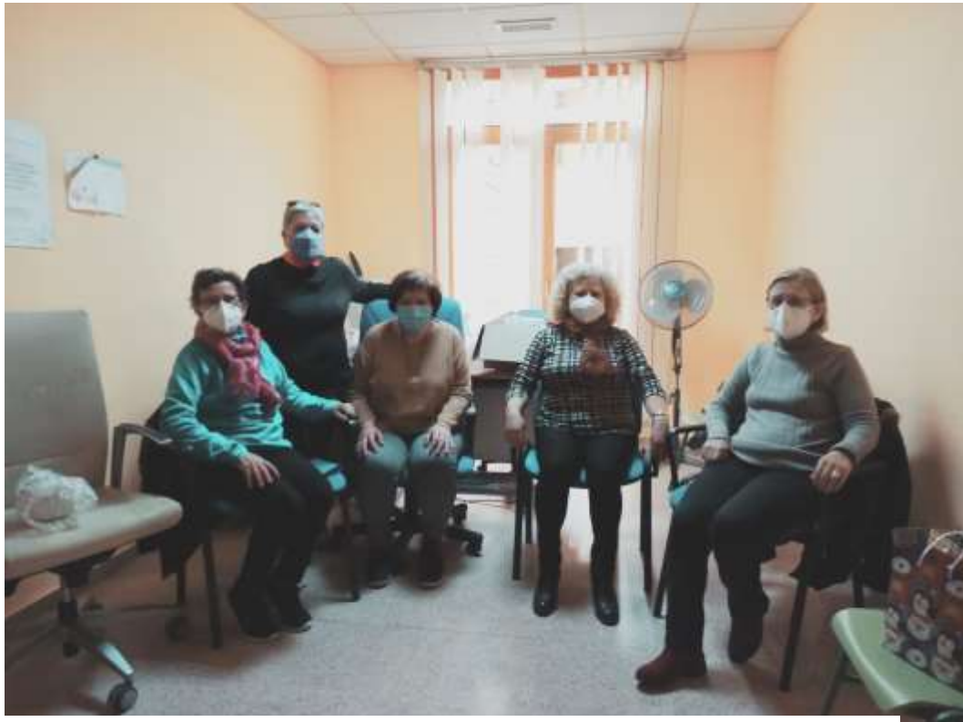
Imagen de Grupo de Autoayuda.