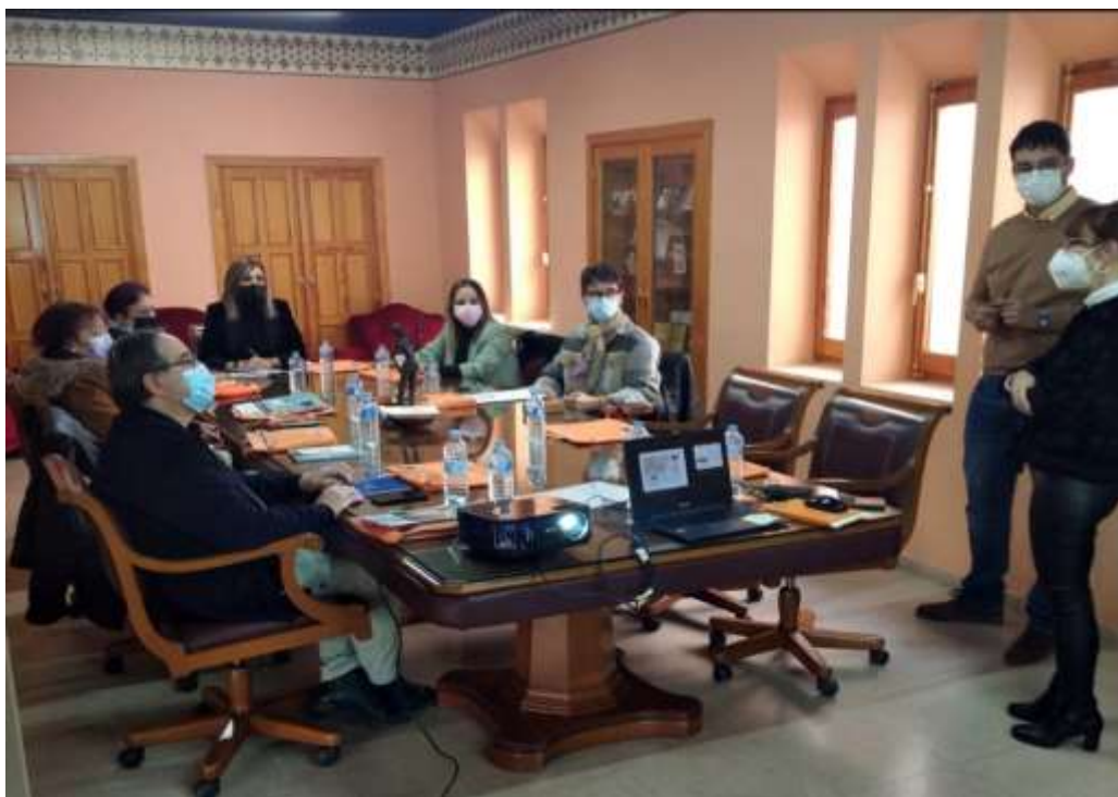
Imágenes de uno de los Talleres y de la Jornada del Programa Capacitativo+55