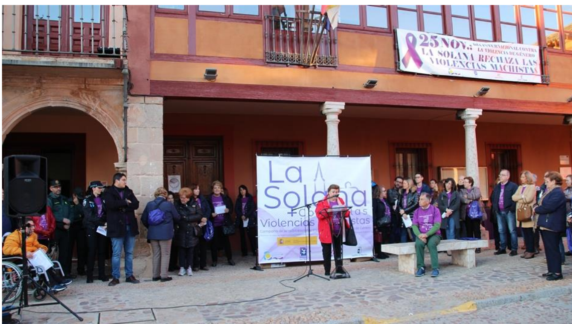
Imágenes de la Concentración contra la violencia de género.