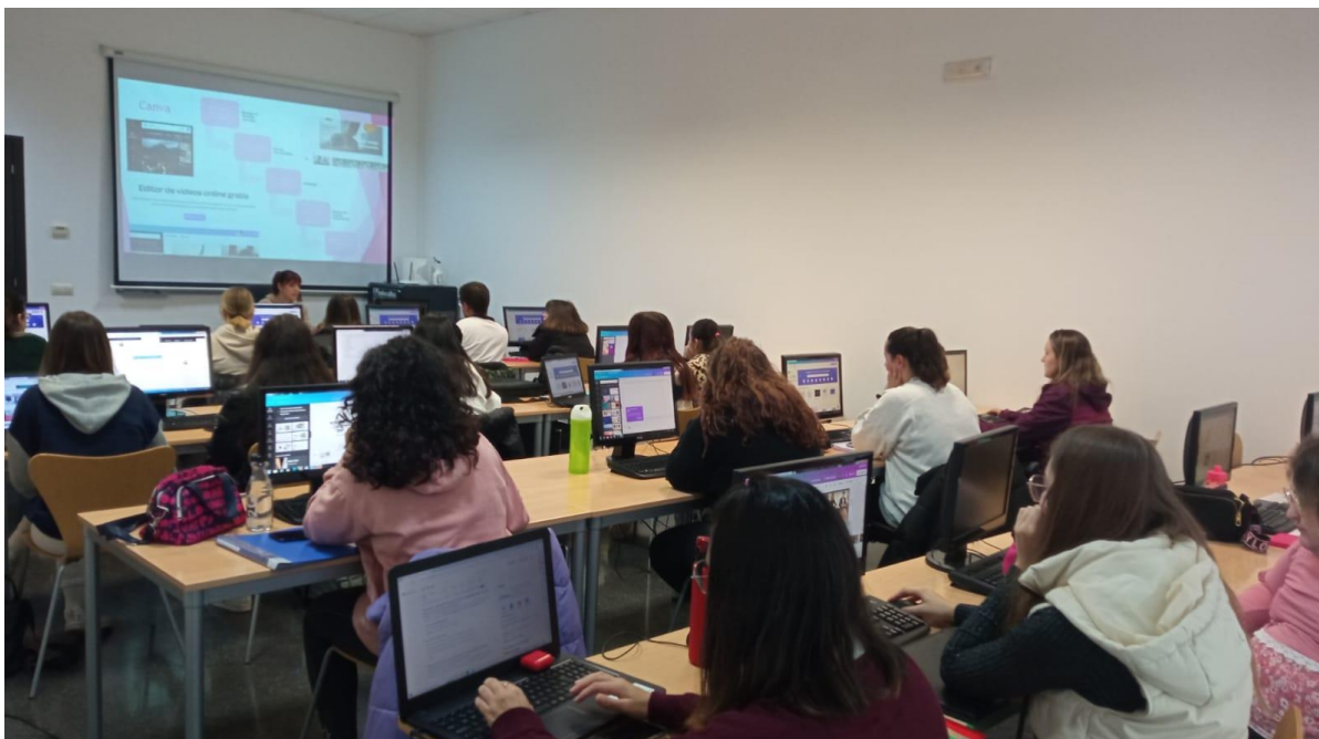
Imagen del desarrollo del Curso