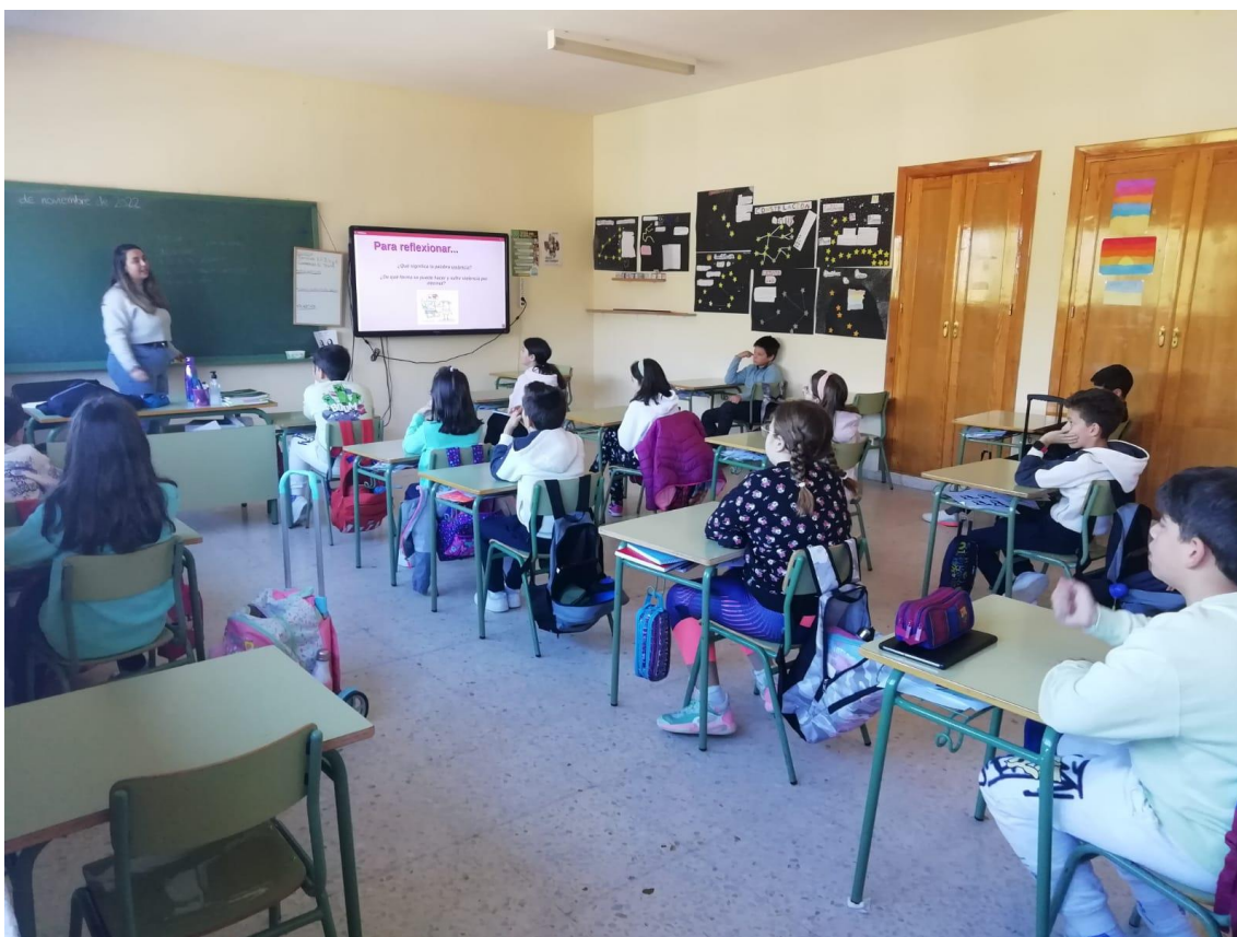
Imagen de uno de los Talleres desarrollados en los colegios