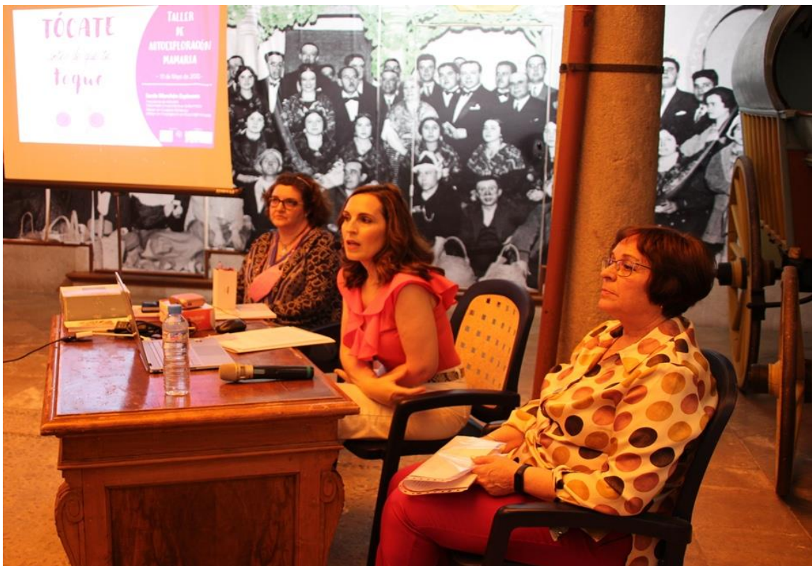
* Imagen de Taller

Los Talleres comprendieron una parte teórica y otra práctica en la que se explicó a las mujeres lo importante que es aprender la técnica de autoexploración mamaria para identificar posibles alteraciones. Se recomendó realizar estas prácticas una vez al mes a lo largo de toda la vida de la mujer, y acudir a nuestro/a médico/a ante cualquier señal de alarma. Se describieron los pasos de una técnica sencilla que se realiza en pocos minutos.