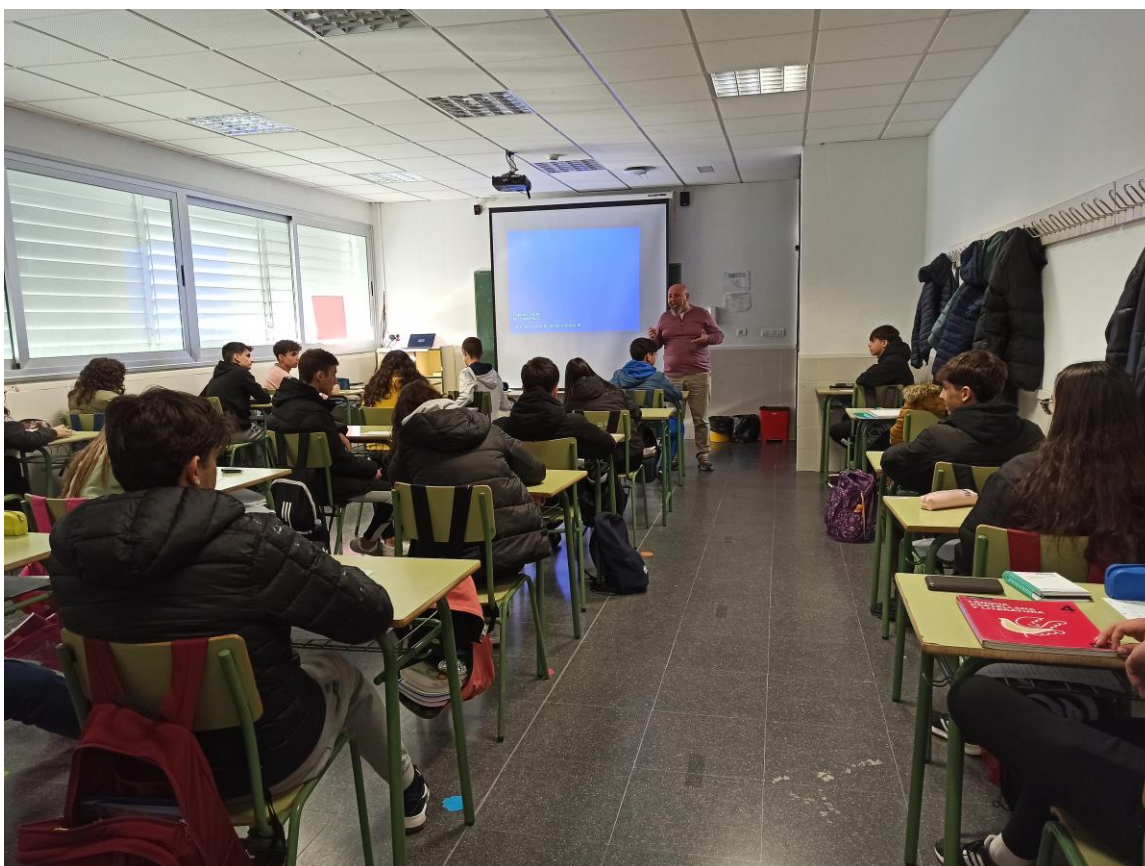
Imagen de uno de los Talleres impartidos en uno de los IES