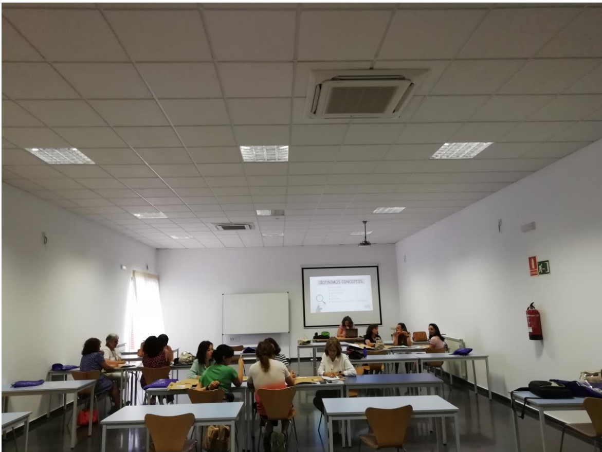
Imagen del Curso dirigido al Personal del Ayuntamiento