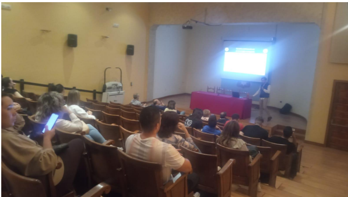
*imagen del desarrollo de las Jornadas

- Se dejó claro que ya es imposible prosperar sin acceso a la red. A ningún empresario/a le puede faltar Internet.