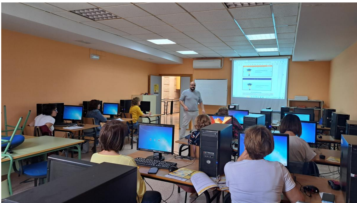
Imagen del Taller Capacitativo+55

Este tuvo una duración de 10 horas y se realizó del 10 al 14 de octubre, en el Aula de Informática del Edificio de Usos Múltiples. Han participado en el mismo, un total de 10 mujeres mayores de 55 años desempleadas de La Solana con bajo nivel de alfabetización digital.