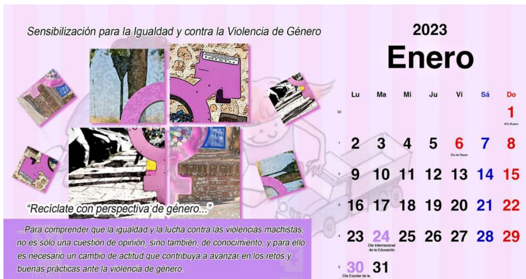
Imágenes del Calendario.