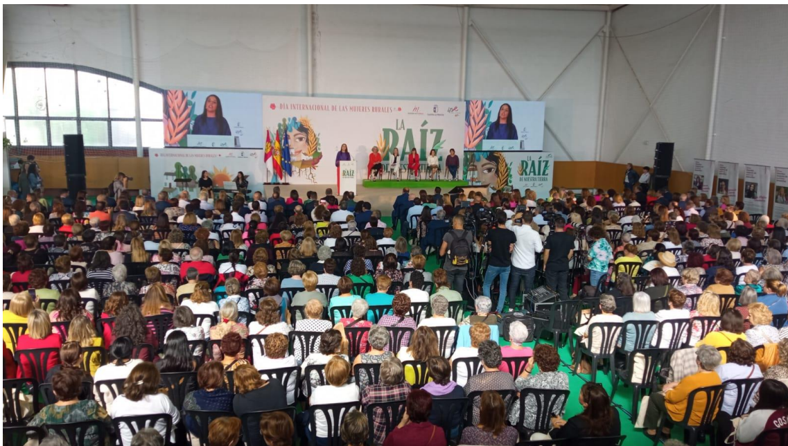
Imagen del Acto Institucional de la Mujer Rural