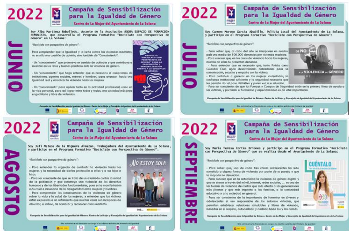
Imagen de las Cuañas que componen la Campaña de Sensibilización 2022