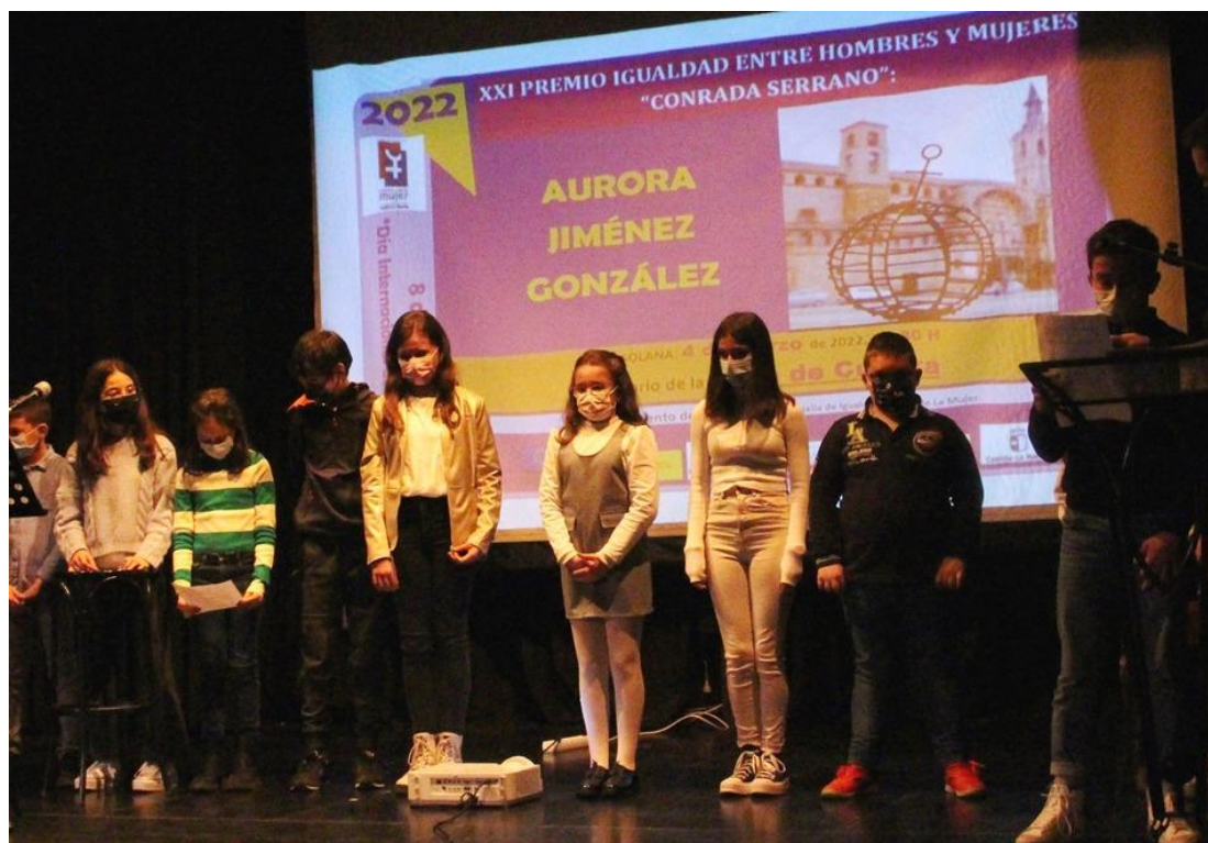
* Imagen de uno de los momentos del Acto.