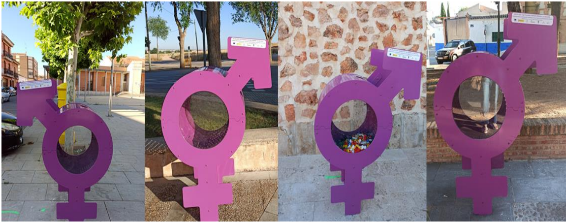
Imagen de los diversos Contenedores ubicados en diferentes calles