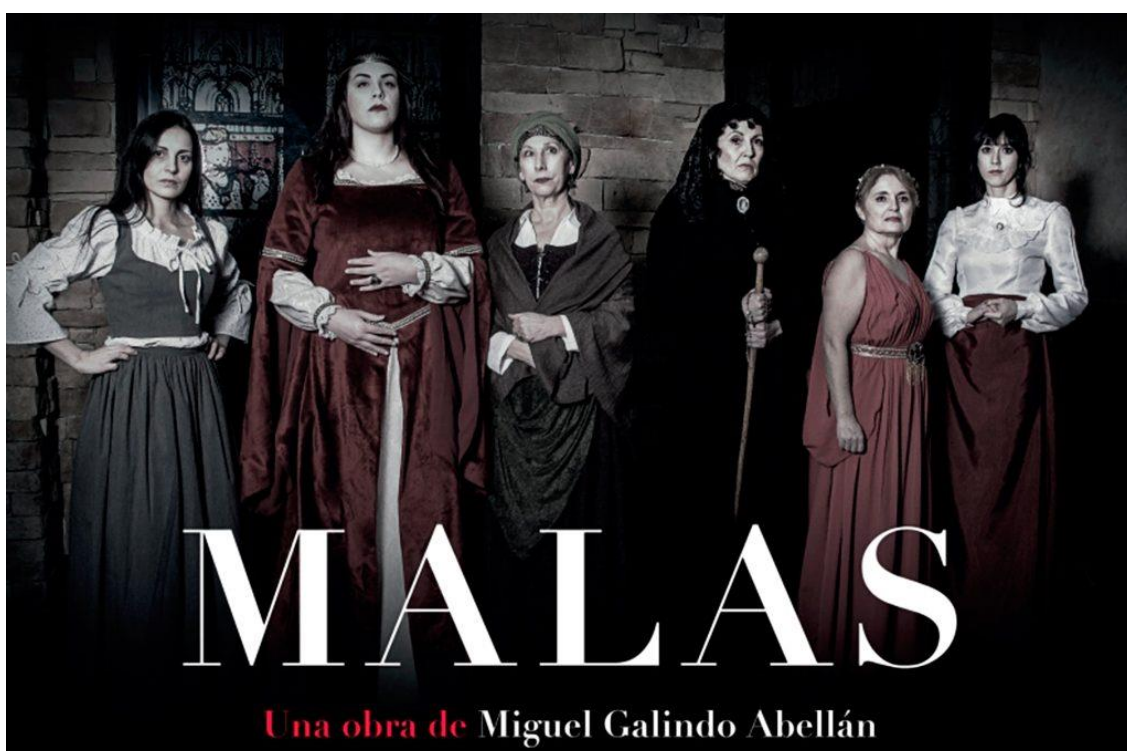
Imagen del cartel de la Obra.

Se representó el día 20 de Noviembre a las 19,30 horas en el Teatro Tomás Barrera.