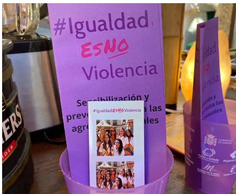
Imagen de la Campaña "Igualdad es no violencia" del IM contra las Agresiones sexuales