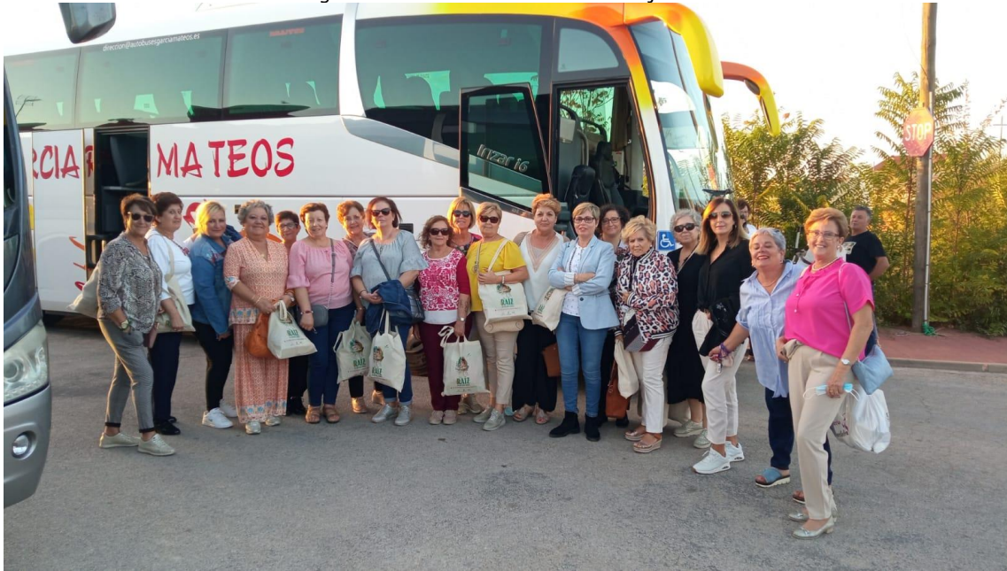
Imagen del viaje en Autobús a Porzuna