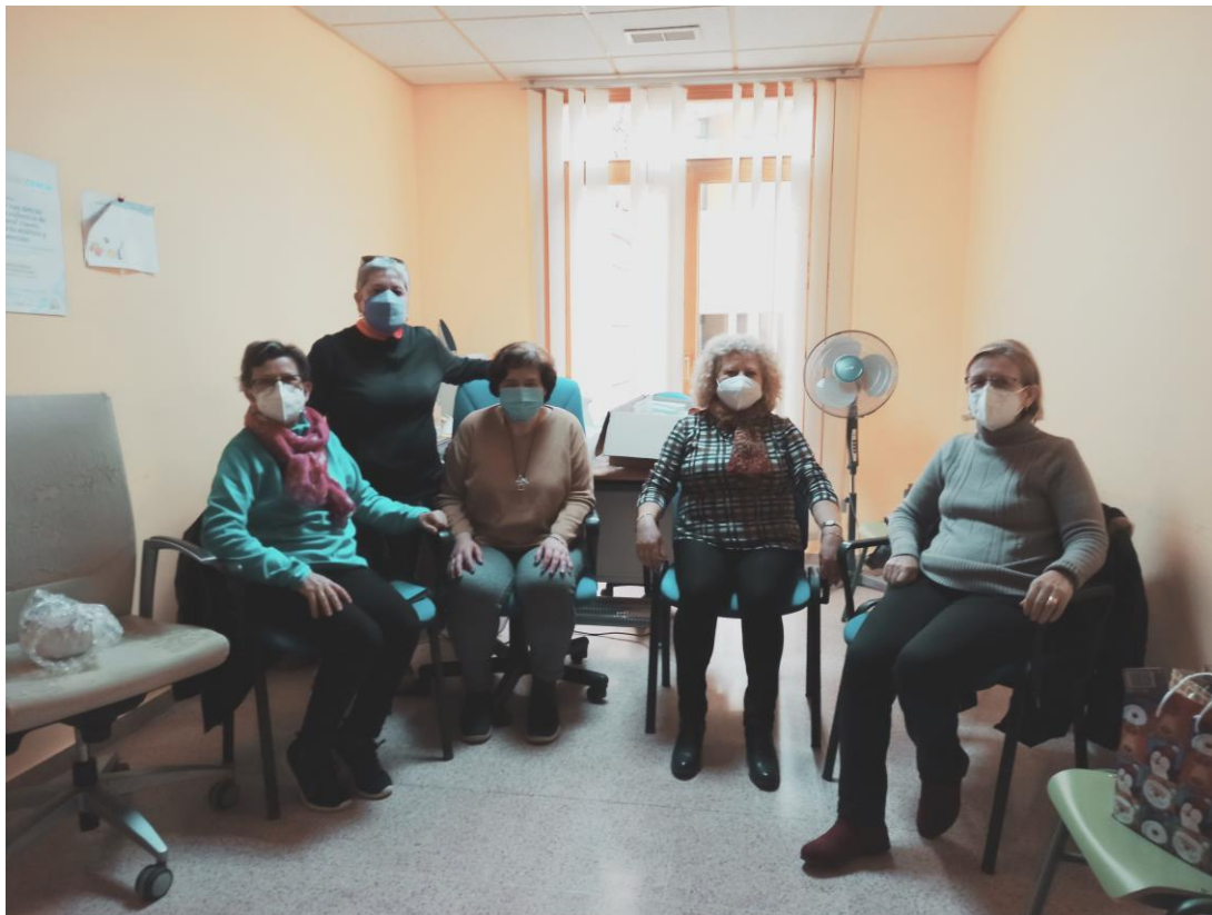
Imagen de Grupo de Autoayuda.