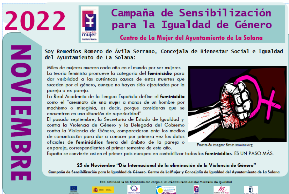
Imagen del contenido de la Cuña radiofónica del mes de Noviembre.

Género comparecieron ante los medios de comunicación para dar a conocer por primera vez los datos oficiales de feminicidios fuera del ámbito de la pareja o ex pareja correspondientes al primer semestre de este año. España se convierte así en el primer país europeo en contabilizar todos los feminicidios. ES UN PASO MÁS. 25 de Noviembre: Día Internacional contra la Violencia de Género”.