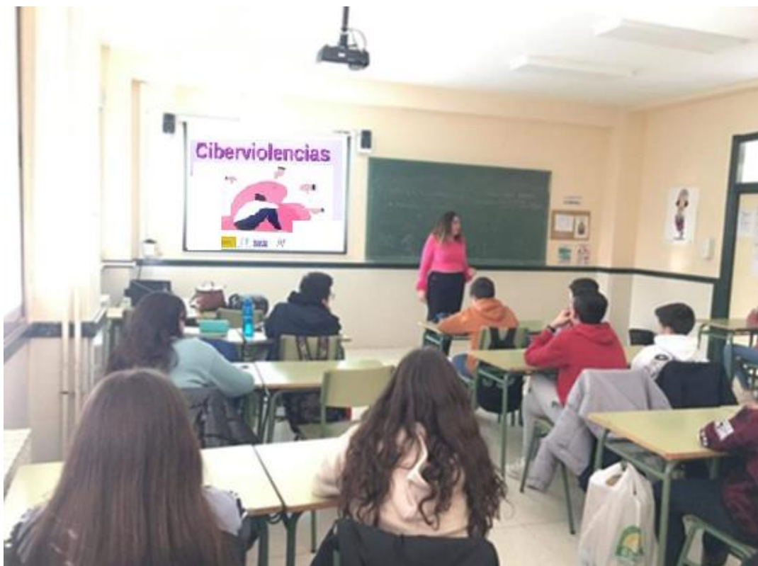
Imagen de uno de los Talleres desarrollados en los IES