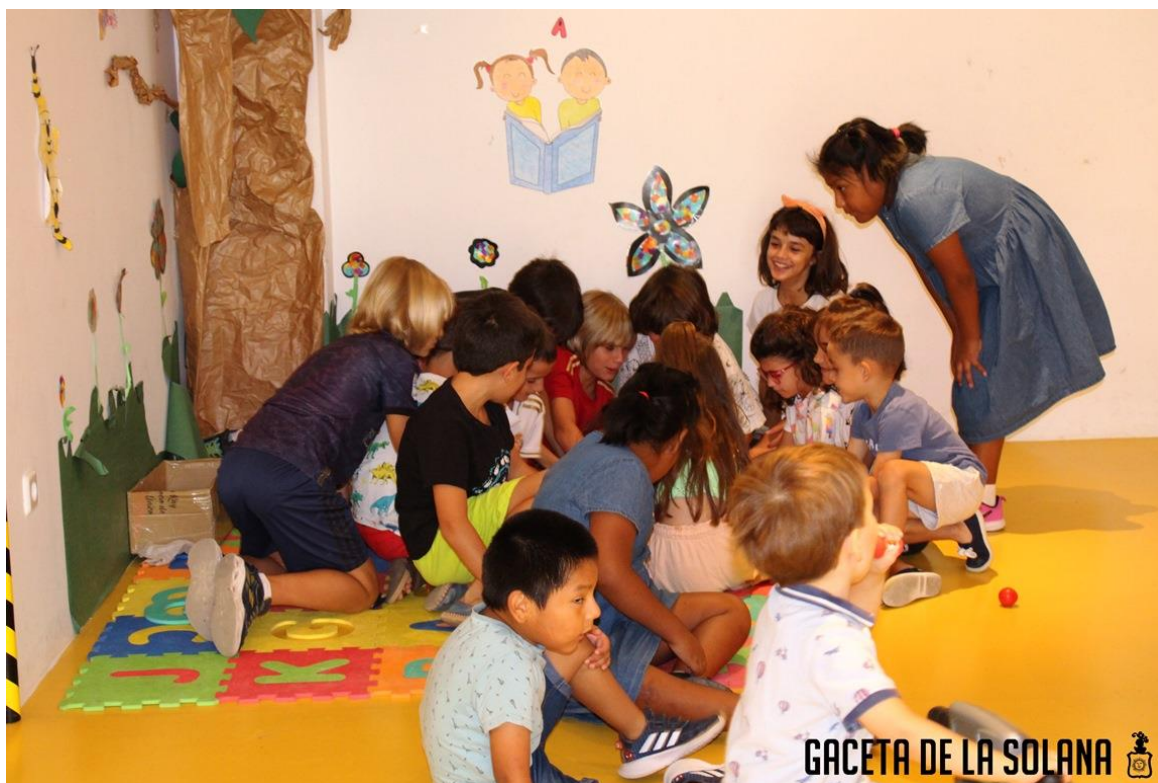
*imagen del Espacio Corresponsables

Durante este año 2022, han asistido al Espacio Corresponsables un número total de 74 menores participantes que desagregado por sexo han sido, 33 niñas y 41 niños. El número total de familias participantes ha sido de 51.