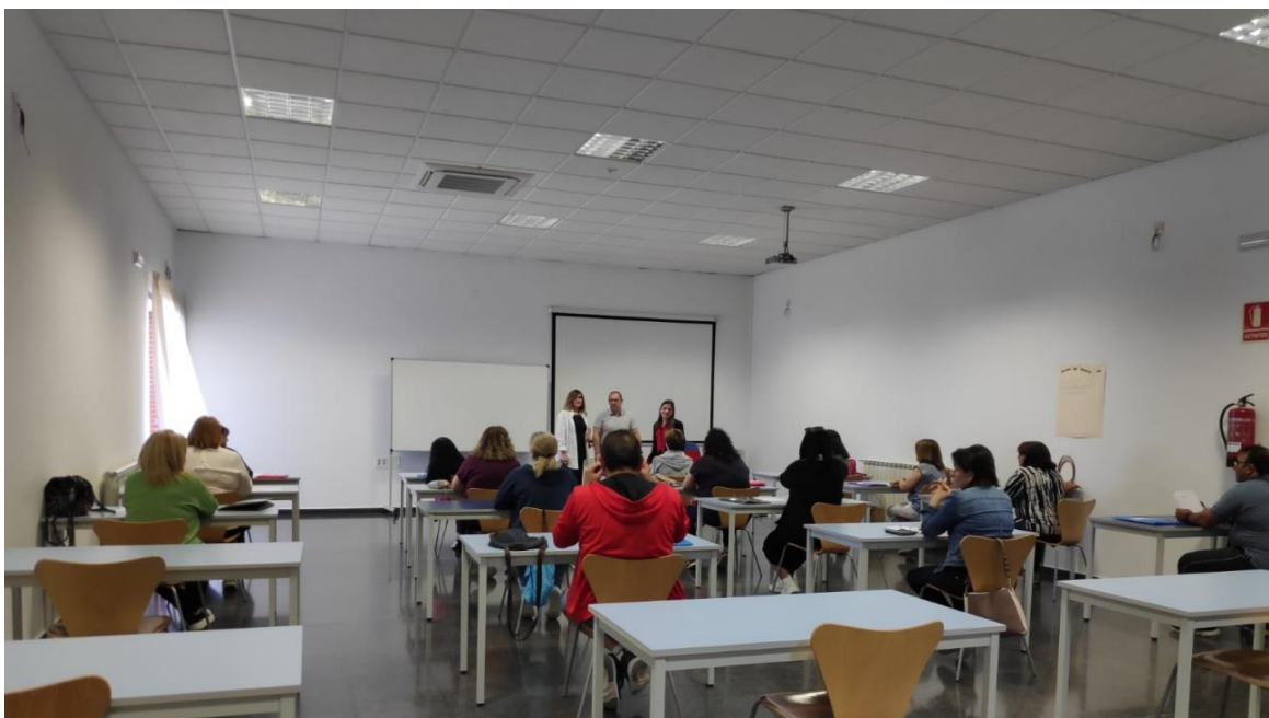
Imagen del Curso de Actividades Auxiliares de Almacén

El lugar de impartición fue el Centro de Nuevas Tecnologías Petra Mateos.