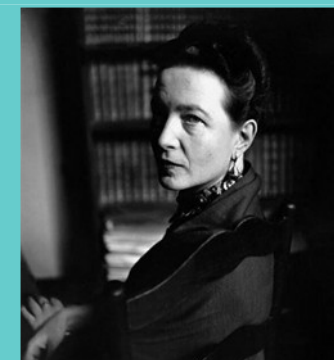
Simone de Beauvoir

C/ Pozo Ermita, 4, 1ª planta. Tfno: 926 6311 03 centrodelamujer@hotmail.es