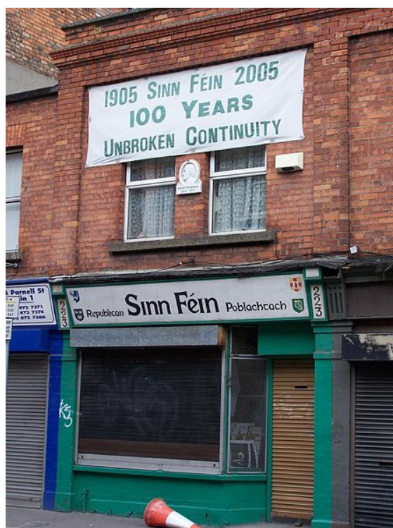
Antigua sede del Sinn Fein en la ciudad de Dublín cerca de Capel Street.

Conquistada en el s. XVII por los ingleses, fue duramente explotada desde entonces. La identidad irlandesa venía determinada por la lengua, el gaélico, la religión, católica, y la opresión británica. El tremendo empobrecimiento que supusieron varias crisis económicas durante el s. XIX y el propio movimiento independentista, encarnado en el Sinn Fein, hicieron que los irlandeses no se conformaran con la autonomía ofrecida por Gran Bretaña y lograran la independencia de la mayor parte de la isla en 1921, pero el Ulster, Irlanda del Norte, siguió bajo dominio británico.