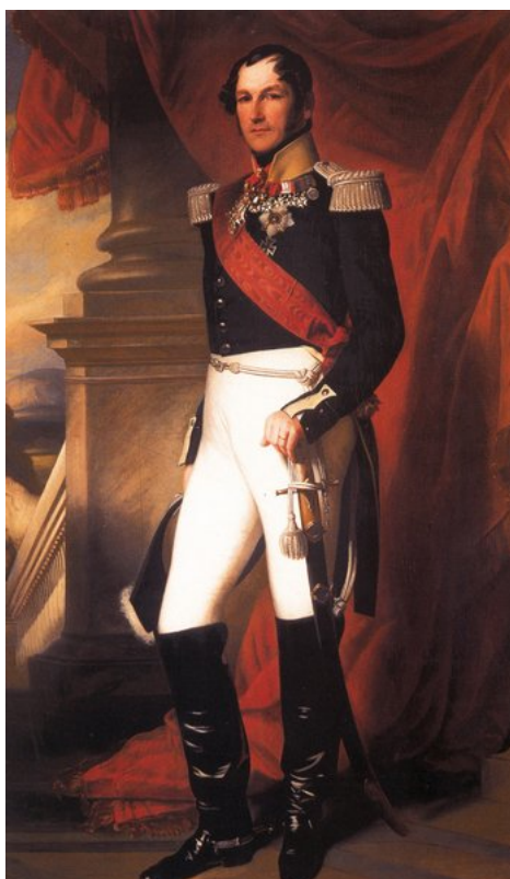
Leopoldo I, primer rey de la Bélgica independiente en 1831

El territorio de la actual Bélgica era dependiente de Holanda tras el Congreso de Viena. Era un país próspero con gran desarrollo económico. La revolución habida en Francia en 1830 provocó el estallido nacionalista belga, que fue apoyado por Francia y por Gran Bretaña para debilitar a Holanda. La independencia se reconoció muy pronto y se instauró una monarquía constitucional y neutral por definición.