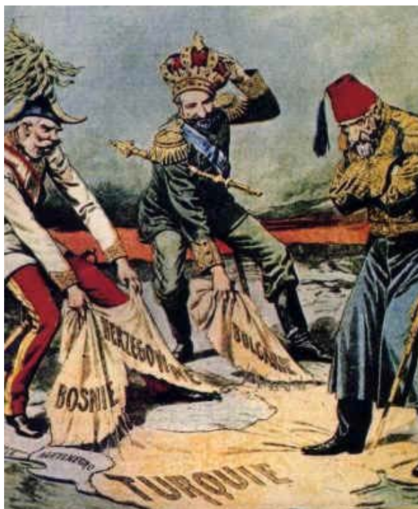
Los imperios austro-húngaro y ruso arrebatan territorios al imperio otomano, según una caricatura de la época.

Sufrió una lenta desintegración desde el s. XVIII, perdiendo, sobre todo en el XIX, Serbia, Grecia, Rumanía, Bulgaria, Albania, etc. La desaparición efectiva del imperio de la Gran Puerta se dio tras ser derrotado en la 1ª Guerra Mundial. Los conflictos y tensiones que hemos visto en el Imperio Austro-Húngaro afectan a estos territorios, pues antes fueron turcos. Especial huella dejaron los musulmanes en los estados de Bosnia-Herzegovina, Albania y Kosovo.