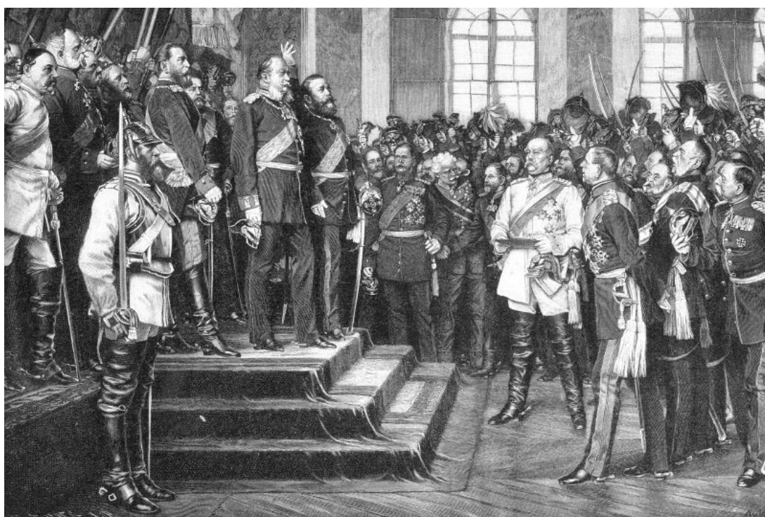
Proclamación de Guillermo I como Kaiser de Alemania en el palacio de Versalles, el 18 de enero de 1871