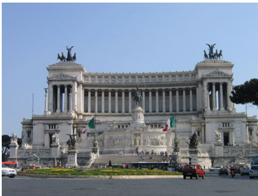
Roma. Monumento a Vittorio Emmanuele II

En cuanto a la segunda fuente del nacionalismo, los acontecimientos históricos, habría que reseñar, en primer lugar, que se vio desatado por la opresión napoleónica, por ejemplo, en España, Rusia y Bélgica. Después fue avivado por las fronteras artificiales trazadas en Europa por el Congreso de Viena y el resto de congresos que se sucedieron. Así, encontramos estados con varias nacionalidades en su interior, una sola nacionalidad incluida en varios estados, naciones sometidas a otras y regiones aisladas con un incipiente sentimiento nacional.