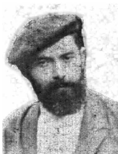
Prat de la Riba y Sabino Arana, destacadas personalidades de los nacionalismos catalán y vasco, respectivamente.

Cataluña fundamentó su nacionalismo en el movimiento cultural conocido como Renaixença y una serie de congresos catalanistas que fueron creando el clima propicio. La Lliga Regionalista de Prat de la Riba y Cambó trabajó activamente a partir de su creación en 1901 por la autonomía catalana. El nacionalismo vasco fue muy distinto. De carácter racista y anti-español, fue fundado por Sabino Arana que creó el nombre Euzkadi , la ikurriña y otros símbolos asumidos hoy por los euskaldunes así como la doctrina que sustenta al P.N.V., fundado en 1895.