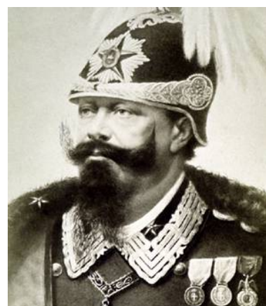
G. Mazzini, C. Benso di Cavour y Vittorio Emmanuele II

Los padres de la unificación serán Giuseppe Mazzini, fundador de “La Joven Italia” y activísimo trabajador por la unificación y Camilo Cavour, Primer Ministro del monarca liberal piemontés Vittorio Emmanuele II, además de otros intelectuales que fueron creando una conciencia nacional italiana como Gioberti, Balbi, etc.