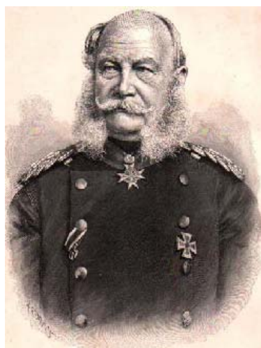
Otto von Bismarck y Guillermo I.