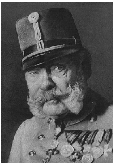
Francisco José I, emperador del Imperio Austro-Húngaro entre 1848 y 1916.