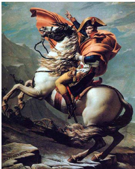
Napoleón cruza los Alpes en una de sus campañas (J.L.David)

Nueva institución gobernada por tres cónsules, siendo Napoleón el primero de ellos, cargo que le proporcionó el control absoluto del Estado.