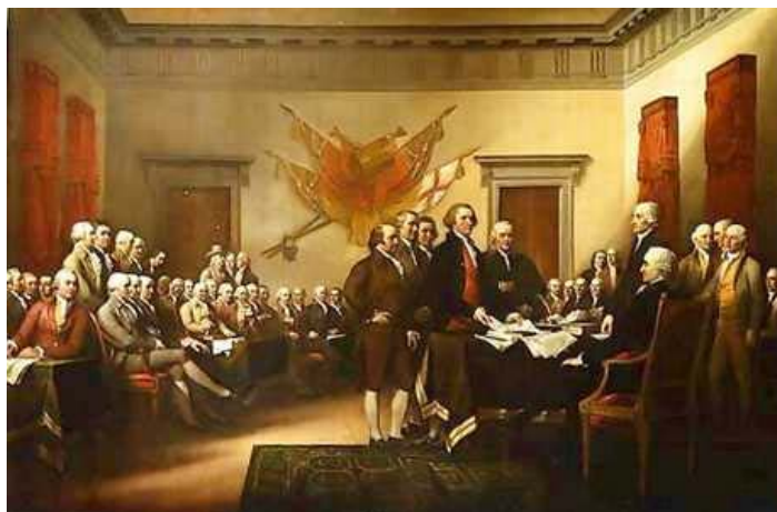
John Adams, Thomas Jefferson y Benjamín Franklin, ante el documento de independencia (preparado por ellos)

La monarquía española, Carlos III de Borbón y la monarquía francesa, Luis XVI, ayudaron a las colonias en su proceso de emancipación de Gran Bretaña.