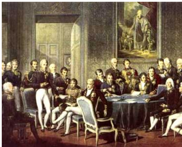
Representantes de las potencias europeas en el Congreso de Viena

Tras derrotar a Napoleón, las potencias vencedoras, Austria, Prusia, Rusia y Gran Bretaña, pretendieron terminar con la situación creada por la Revolución francesa y el Imperio napoleónico, se reunieron en el denominado Congreso de Viena, para la Restauración de los principios monárquicos del Antiguo Régimen.