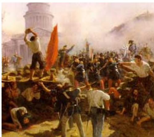
Alzamientos en París que llevaron a la Revolución de 1848 en Francia

Grecia, consigue la independencia del imperio otomano. Bélgica se independiza de Holanda. Movimientos en Polonia y en determinados estados italianos (Módena, Parma, Bolonia) y alemanes (Sajonia, Brunswick, Hannover...)