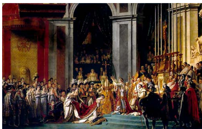
Autocoronación de Napoleón. El Papa Pio VII asiste como testigo. (J.L.David)

Finalmente, fue nombrado Cónsul vitalicio con ilimitados poderes en 1802.