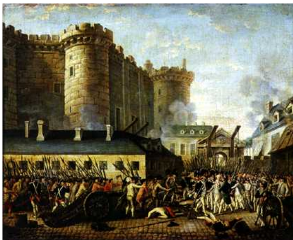
El pueblo de París, amotinado, toma la bastilla el 14 de julio de 1789

Al ser sus peticiones, el estado llano, se constituyó en Asamblea Nacional el 17 de junio. Luis XVI, ante la escisión de los Estados Generales decidió disolver la Asamblea que el 7 de julio pasó a denominarse Asamblea Constituyente. La actuación del rey, la vida de la corte en Versalles, ajena a los problemas del pueblo, provocó el amotinamiento en las calles de París, asaltando la prisión de la Bastilla el 14 de julio de 1789.