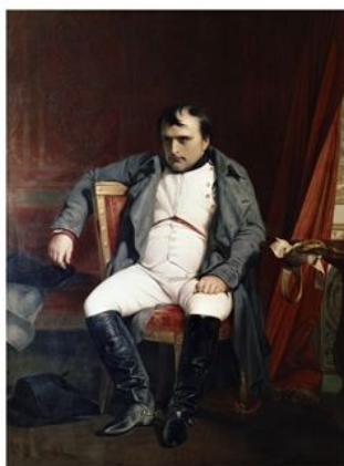
Las campañas de Rusia y España, fueron un duro revés para el emperador

Napoleón defendía la idea de una Europa bajo un solo mando. Una vez proclamado emperador, logró extender su poder por gran parte del continente, derrotando a los ejércitos formado por distintas coaliciones de países, estableciendo un bloqueo económico contra Gran Bretaña para doblegarla.