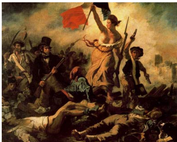
La libertad guiando al pueblo (Delacroix 1831)