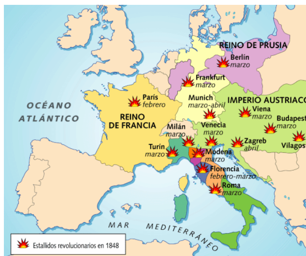
Las Revoluciones de 1848 en Europa