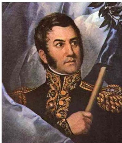
José de San Martín (1778 – 1850) Argentina