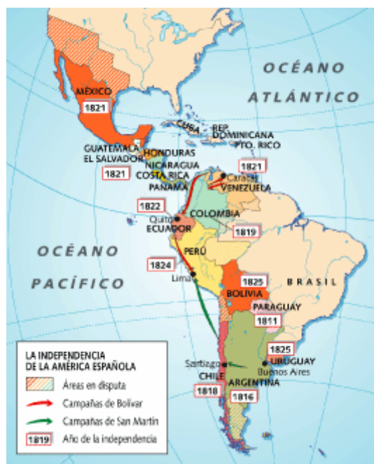
Campañas durante el proceso de independencia de la América española

La independencia de las colonias americanas la protagonizan fundamentalmente los criollos , enriquecidos por el comercio y las propiedades territoriales, y animados por la experiencia de independencia de Inglaterra de las trece colonias Norteamericanas y los principios liberales, aspiraban a controlar el poder político en su provecho.