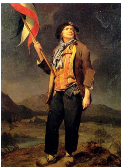
Un "sans coulottes", enarbolando la bandera de la revolución

La falta de soluciones ante los problemas que atravesaba el pueblo, la agitación social en el interior del país, iba en aumento y en el exterior, las monarquías absolutas de Austria y Prusia, preocupadas ante la posible extensión de las nuevas ideas revolucionarias a sus países y pusieran en peligro el absolutismo, declararon la guerra a la Francia revolucionaria.