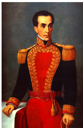
Simón Bolívar, el Libertador (1783 – 1830) Venezuela

Los principales focos independentistas fueron Argentina, Méjico y Venezuela, destacando sus líderes más importantes: Hidalgo, Morelos, San Martín y Simón Bolívar.