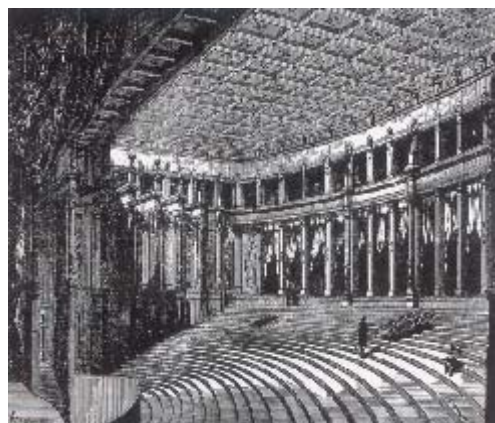
Affiche de la primera representación de La Traviata, de Verdi, en el Teatro La Fenice, de Venecia, el 6 de marzo de 1853 y una imagen del teatro de Bayreuth hacia 1870, especialmente concebido para las óperas de Wagner.