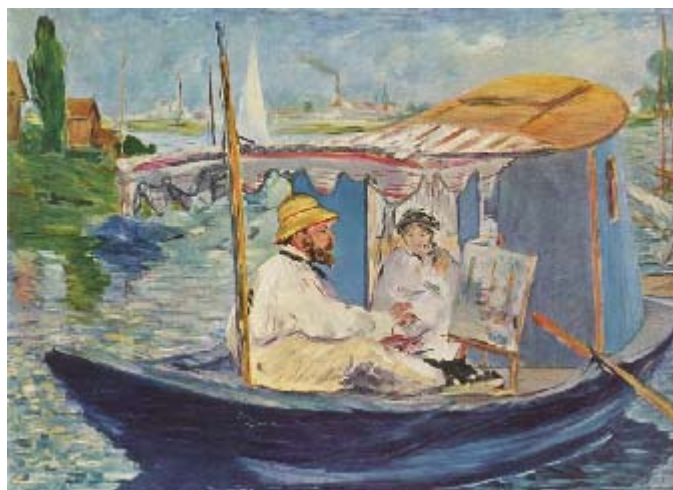
Monet en su taller flotante en el Sena, pintado por Manet.