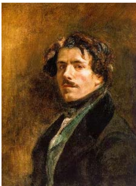
Autorretrato de Delacroix, pintado hacia 1837.

Esta corriente se fija mucho en el individuo y sus gestas heroicas, así como en su lucha por la libertad. Como autores fundamentales tenemos a Géricault, en el que destacan su agitación y dramatismo, como en La balsa de La Medusa ; Delacroix se caracteriza por la luminosidad y la violencia de sus cuadros. Así se ve, entre otros, en La muerte de Sardanápalo . También incidirán mucho en el impresionismo los ingleses Turner y Constable , situados a caballo entre los siglos XVII y XVIII, con sus paisajes brumosos y melancólicos.