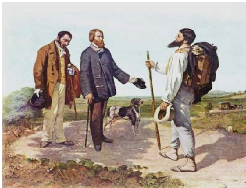
"Bonjour, monsieur Courbet". En esta obra del propio artista podemos contemplarlo con sus útiles para pintar al aire libre

Esta corriente se da, aproximadamente, entre 1848 y 1870. Eligen temas contemporáneos y abandonan los medievales, antiguos u orientales. Pretenden pintar la realidad en su entorno natural (de ahí su nombre: realismo o naturalismo). En este afán, no desdeñan los aspectos menos agradables de la sociedad ni las clases más desfavorecidas. Corot es un gran paisajista que se enfrenta directamente al objeto y marca la evolución del paisaje clásico al realista; será uno de los antecedentes del impresionismo junto con los pintores de la Escuela de Barbizon que pintan paisajes y los efectos de la luz en ellos, pero con tonos más oscuros que los impresionistas. Courbet pintó temas de la vida cotidiana tratados con gran sencillez, por lo que fue muy rechazado por la crítica, que lo tachó de pornográfico. De afiliación socialista refleja en sus obras la situación dramática de las clases populares. Daumier muestra también un gran compromiso social y una cruda crítica; concede en sus obras escasa importancia al dibujo, siendo un gran acuarelista. Millet suele pintar escenas campesinas llenas de melancolía e idealización.