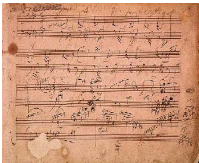
Manuscrito original de Beethoven de la Sonata para piano Op. 106, Hammerklavier.