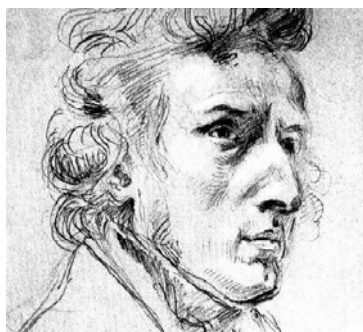
F. Chopin según un dibujo de Delacroix.

El siglo XIX, musicalmente hablando, comienza por el romanticismo, que tendrá en música una importancia capital pues, al propugnar la expresión de sentimientos e ideas soñadoras e inconcretas, encuentra en la música la expresión artística más adecuada debido a su intangibilidad y abstracción. En este sentido Ludwig van Beethoven es considerado el último compositor clásico y el primer romántico, aunque la magnitud de su figura excede a cualquier clasificación, como ocurre con Goya. Beethoven abre el paso al núcleo romántico por excelencia, formado por Weber, Schubert, Schumann, Chopin, Liszt y Wagner. Este será el centro del romanticismo aunque destacan, además, en Francia Berlioz y en Italia Paganini. Este movimiento encuentra en el piano, una vez perfeccionado técnicamente, su instrumento ideal, para el que revoluciona su escritura. Ahora vive este instrumento su edad de oro y su mayor virtuosismo. Otra forma muy querida de los románticos será el lied .