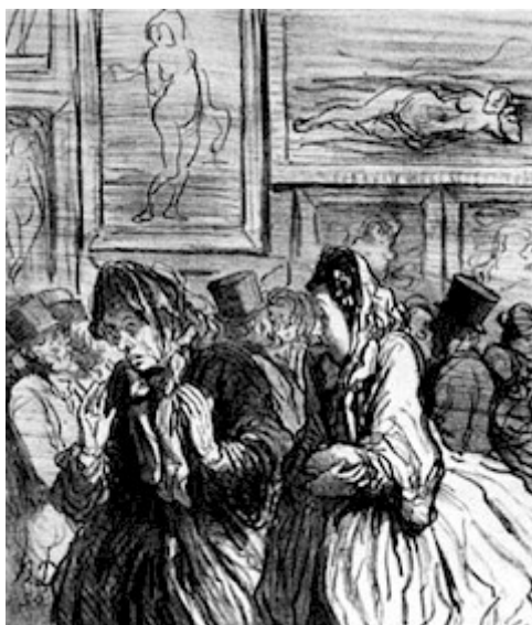
Daumier satiriza a los burgueses escandalizados ante las Venus en el Salón oficial de 1864