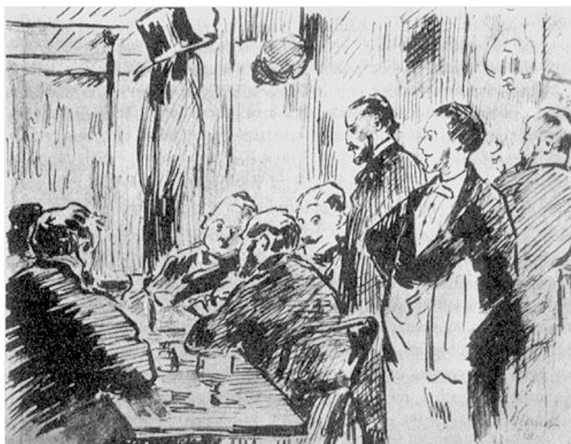
Tertulia del café Guerbois , de Manet, 1869.

A principios de los años 60 unos jóvenes pintores deciden romper con todos los convencionalismos anteriores. Su preocupación constante es el color y la luz, quieren reflejar los cambios de la luz en los objetos y la naturaleza y, para ello, pintan al aire libre. Su técnica es suelta y ligera, las pinceladas y los colores se funden no en el cuadro sino en el ojo del espectador. Tienen una nueva valoración de la luz aportando un nuevo colorido: no hay forma ni color, sólo la relación aire-luz. Igualmente la valoración del espacio es nueva, con encuadres y angulaciones insospechados hasta entonces. Los temas que tratan son desenfadados, de la sociedad burguesa de su época, junto con paisajes, bodegones, retratos, etc. Entre sus antecedentes encontramos, junto a algunos realistas, a sus admiradísimos Velázquez y Goya y fueron muy influenciados también por la estampa japonesa y la fotografía.