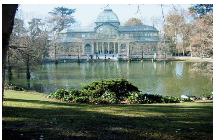
Palacio de Cristal, en el Retiro (Madrid), iniciado en 1887 por Ricardo Velázquez.

Estos nuevos materiales se incorporan a la Arquitectura gracias a los avances de la Revolución Industrial: son el hierro, el cemento y el vidrio. Las nuevas posibilidades técnicas y las nuevas necesidades sociales hacen que aparezcan nuevos edificios como estaciones de ferrocarril, puentes, etc. Aparece también una nueva figura: la del ingeniero, dando paso a la arquitectura funcional. Como obras, destaca entre todas la Torre Eiffel . En Chicago surge la llamada Escuela de Chicago, que realiza una nueva ordenación urbana creando los rascacielos.