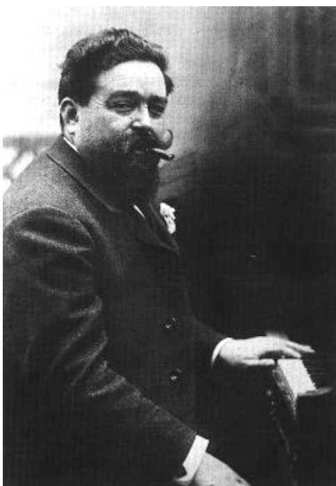
Isaac Albéniz al piano, hacia 1901.

que aportan gran variedad al movimiento. En Rusia destacan Glinka y “el grupo de los cinco”, es decir, Mussorgsky, Cui, Balakirev, Borodin y Rimsky-Korsakov. Otro compositor, Tchaikovsky, se aleja algo de esta tendencia. En lo que será Checoslovaquia encontramos a Smetana, Dvorak y Janacek; en Hungría, a Bela Bartok y Zoltan Kodaly; en Noruega a Grieg y en Finlandia a Sibelius; en España, finalmente, destacan Albéniz y Granados. Muchos de estos compositores mantienen el nacionalismo hasta bien entrado el siglo XX.