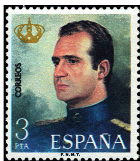
Juan Carlos I, rey de España. Sello de correos conmemorativo

El 22 de noviembre de 1975, Juan Carlos I fue proclamado Rey de España por las Cortes, de acuerdo con lo establecido en la Ley Orgánica del Estado, a pesar de ser su padre Don Juan de Borbón la persona que tenía los derechos dinásticos de sucesión a la corona. En el año 1977, Don Juan renunció a sus derechos en favor de su hijo al que reconoció como Rey de España.