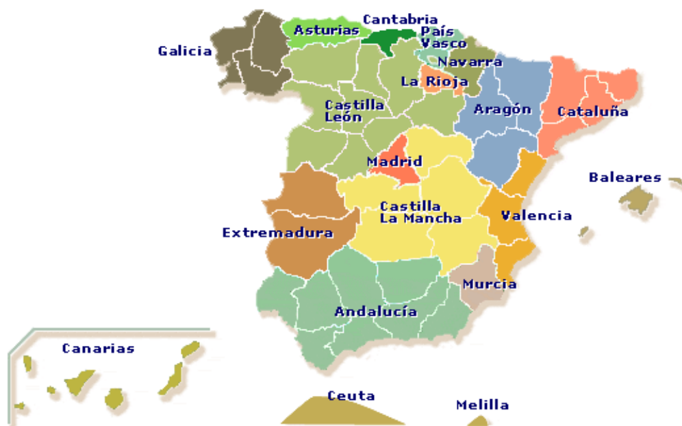
Mapa de autonómico de España.

En el año 1983 estaban aprobados los 17 estatutos de las Comunidades Autónomas y en el año 1995, Ceuta y Melilla se constituyeron como ciudades autónomas. Este proceso supuso el reparto con el Estado de determinadas competencias políticas y administrativas.