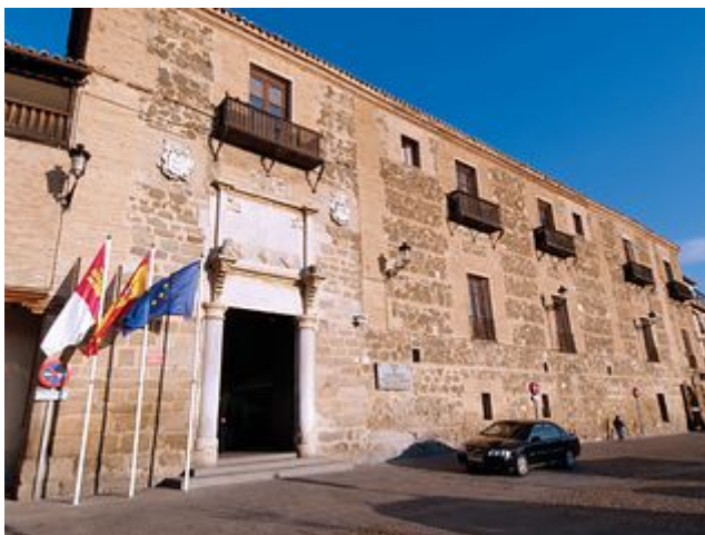
Palacio de Fuensalida en Toledo, sede del Gobierno de la JCCM.

El presidente es el máximo representante regional y ostenta la representación del Estado en la comunidad. Es elegido por las Cortes de Castilla-La Mancha, y nombrado por el Rey de España.