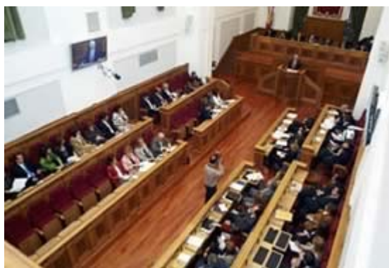
Sesión de las Cortes regionales.

El poder judicial cuya máxima instancia es el Tribunal Superior de Justicia de la comunidad, con sede en Albacete, sometido al Tribunal Supremo del Estado. Otra importante institución de la comunidad castellano-manchega es el Defensor del Pueblo , nombrado por las Cortes regionales, para proteger y defender los derechos y libertades de los ciudadanos ante los abusos que puedan cometer los funcionarios públicos.