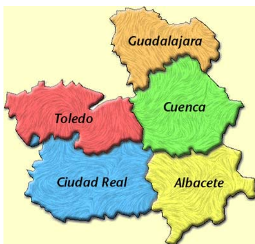
Provincias de la comunidad de Castilla-La Mancha.

PIB de renta per cápita, destacando en los últimos años el nivel de crecimiento y desarrollo alcanzado que ha superado a otras regiones autonómicas con mayor PIB. Importante es la situación estratégica a nivel nacional al estar situada en el centro peninsular y configurar un eje importante en las relaciones norte-sur y este-oeste. En la actualidad se está potenciando el comercio exterior que presenta un nivel por debajo de la media española.