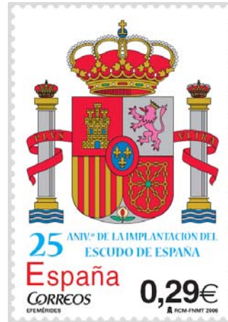
Sello conmemorativo del 25 aniversario de la implantación del Escudo Constitucional