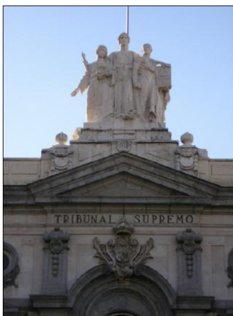
Tribunal Supremo del estado con sede en Madrid.

El poder judicial , cuya máxima instancia es el Tribunal Superior de Justicia de la comunidad, sometido al Tribunal Supremo del Estado.