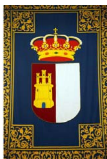
Escudo de Castilla-La Mancha.

El escudo es partido, en el primer cuartel, en campo de gules un castillo de oro almenado, aclarado de azur y mazonado de sable. El segundo cuartel, campo de argento plata. Al timbre, corona real cerrada, que es un círculo de oro engastado de piedras preciosas, compuesto de ocho florones, de hojas de acanto, visibles cinco, interpolado de perlas y de cuyas hojas salen sendas diademas sumadas de perlas, que convergen en un mundo de azur o azul, con el semimeridiano y el ecuador de oro sumado de cruz de oro. La corona forrada de gules o rojo, como reconocimiento de la monarquía española. Realidad social de Castilla-La Mancha.