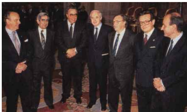
Los padres de la Constitución, encargados de elaborar el texto constitucional.

Pacte Democràtic per Catalunya y uno de Alianza Popular), se les denominó los “padres de la Constitución” .