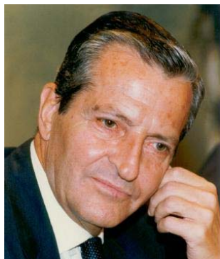
Adolfo Suárez, Presidente del Gobierno de España, artífice de la transición democrática

Suárez presidió el segundo gobierno de la era monárquica, se rodeó de gente joven procedente del franquismo y se apoyó en personas, procedentes de sectores democristianos que, creían en el cambio político.