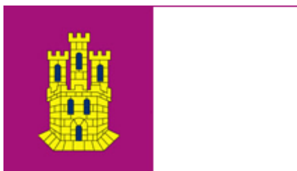
Bandera de Castilla-La Mancha.

La Bandera , dividida en dos partes iguales, una de color rojo carmesí con un castillo de tres torres tomado del pendón de Castilla y la otra blanca.