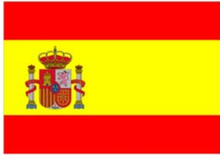
Bandera constitucional de España.

Pueblo que se encarga de la defensa de los derechos y libertades de los ciudadanos y el Tribunal Constitucional que estudia las leyes para que no contradigan lo establecido en la Constitución.