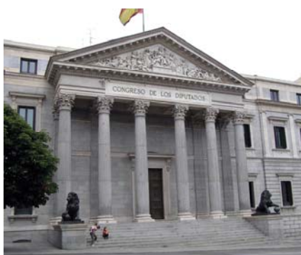
Congreso de los Diputados