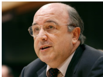
El comisario español Joaquín Almunia

Sus funciones consisten en presentar propuestas (iniciativas) legislativas al Consejo de la UE y al Parlamento, así como de controlar la aplicación y ejecución de las políticas de la UE y de gestionar su presupuesto.