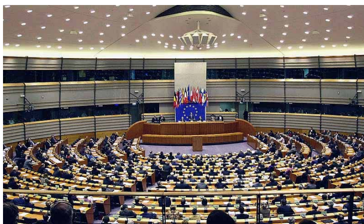
Sesión del Parlamento Europeo

Sus funciones son las de participar en la elaboración de la legislación comunitaria (mediante un procedimiento de codecisión con el Consejo de la Unión Europea). Controla además el funcionamiento de la Comisión Europea junto con el Consejo. Tiene su sede en la ciudad francesa de Estrasburgo, aunque algunas actividades se realizan en Bélgica y en Luxemburgo.