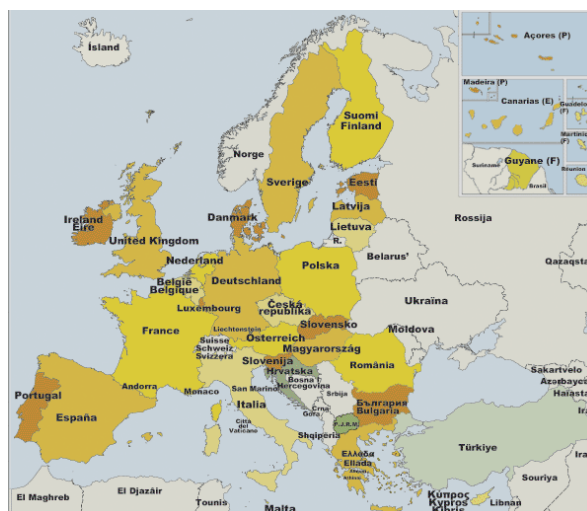
Mapa de la Unión europea. Año 2008.

Los nombres de los países miembros de la Unión Europea (en orden alfabético) son: Alemania; Austria; Bélgica; Bulgaria; Chipre; Dinamarca; Eslovaquia; Eslovenia; España; Estonia; Finlandia; Francia; Grecia; Holanda; Hungría; Irlanda; Italia; Letonia; Lituania; Luxemburgo; Malta; Polonia; Portugal; Reino Unido; República Checa; Rumania; y Suecia.