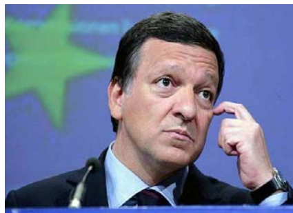
El presidente de la Comisión Europea, José Manuel Durao Barroso