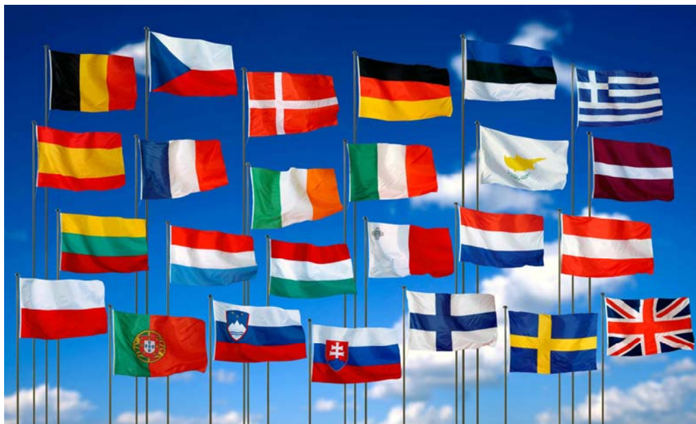
Banderas de los países que constituyen la UE.

También se mantuvo abierta una política de nuevas adhesiones y se admitió en la UE a países como Estonia, Letonia, Lituania, República Chequia, Hungría, Eslovaquia, Eslovenia, Chipre y Malta, que se integraban en el año 2005. Dos años después ingresaban Rumanía y Bulgaria.