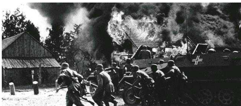
Las tropas de la Wehrmacht invaden Polonia