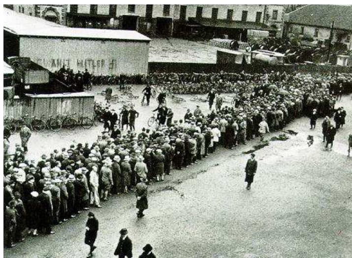
Cola de parados buscando empleo en Hannover (1921)

La posguerra es muy dura en Alemania y se inicia con revueltas espartaquistas y separatistas. La vida, en consecuencia, de la República de Weimar es corta y difícil. Solamente encontrará una tibia recuperación a partir de 1925 y ésta se hará trizas con la crisis de 1929, de tal manera que Alemania llegó a contar en 1932 con 5 millones de parados.