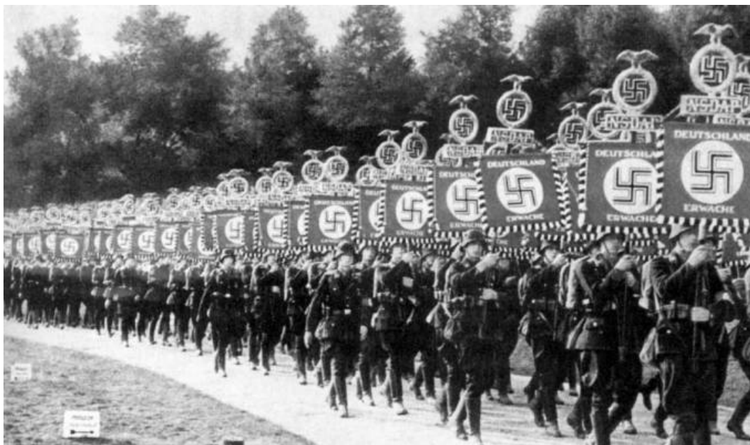
El soldado es el ideal de vida nacionalsocialista