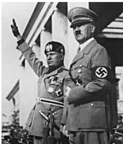
Los líderes carismáticos: Hitler y Mussolini