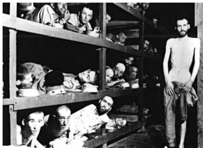
El final: los judíos, entre otros grupos, esperan en inhumanos campos de concentración una muerte segura