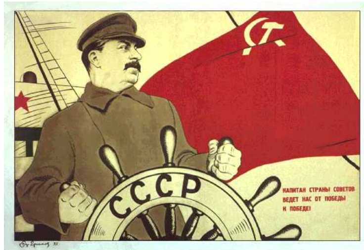
Cartel soviético de 1933 en el que se rinde culto a Stalin como guía de la URSS

A partir de ese momento el gobierno ruso se transformó en la dictadura personal de Stalin, el “estalinismo”, que ejerció un poder absoluto sobre el pueblo soviético a través del P.C.U.S. (Partido Comunista de la Unión Soviética). Este dirigió férreamente también los Partidos Comunistas de casi todo el mundo mediante la creación de la Komintern, la Internacional Comunista, o III Internacional, en 1929. Salvo por su inspiración ideológica, el gobierno totalitario de Stalin tiene muchos rasgos comunes con el totalitarismo fascista y nazi que hemos visto anteriormente. Como en la Alemania de Hitler, una poderosa policía secreta, la NKVD , controlaba cualquier tipo de disidencia frente a Stalin, incluso entre los miembros del Partido Comunista, muchos de cuyos líderes fueron encarcelados, deportados o asesinados.