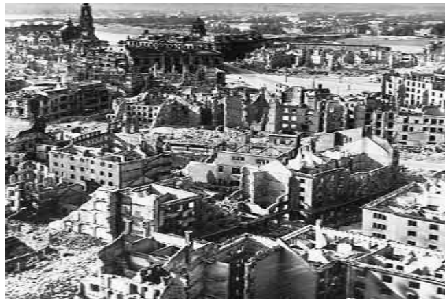
La ciudad alemana de Dresde en 1945