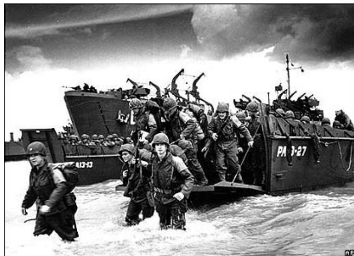
Desembarco de tropas estadounidenses en Normandía

En Europa tiene lugar el definitivo Desembarco de Normandía y Berlín caerá en Mayo de 1945. En el Pacífico, para acabar rápidamente la guerra, se lanzan las dos bombas atómicas sobre el Japón en Agosto de 1945 tras lo que capitulará inmediatamente.