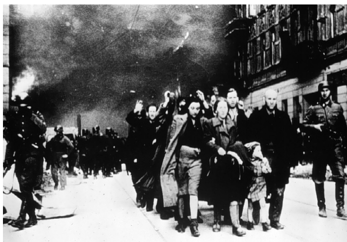
El principio: arresto de judíos durante la Kristallnacht

En la economía, el nazismo logró que el rearme y la industria militar absorbieran rápidamente el paro. Sus relaciones con el gran capital serán excelentes mientras que Alemania se orienta a la autarquía. Su política exterior será claramente expansionista y una de las causas directas de la 2ª Guerra Mundial.