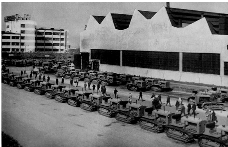
Fábrica de tractores soviética en 1930

A partir de 1928 Stalin acomete la industrialización acelerada de Rusia dirigida por el Estado, que es dueño de todos los medios de producción y del capital, poniendo fin a la N.E.P. El gobierno establecería todos los objetivos de la economía, las condiciones de trabajo, los salarios, las industrias que debían crearse, los bienes que debían producirse, etc..., mediante los sucesivos Planes Quinquenales. El campo fue colectivizado, lo que provocó numerosas protestas. La industrialización se centró en la industria pesada y de armamento, en las infraestructuras y en el desarrollo de regiones aisladas del enorme estado soviético. El esfuerzo permitió a la U.R.S.S. erigirse en una primera potencia mundial pero sin que sus habitantes vieran mejorar su nivel de vida, aunque sí tenían las necesidades básicas cubiertas.