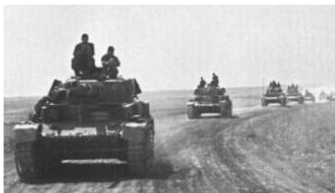
Las divisiones blindadas alemanas fueron las protagonistas de la “guerra relámpago”