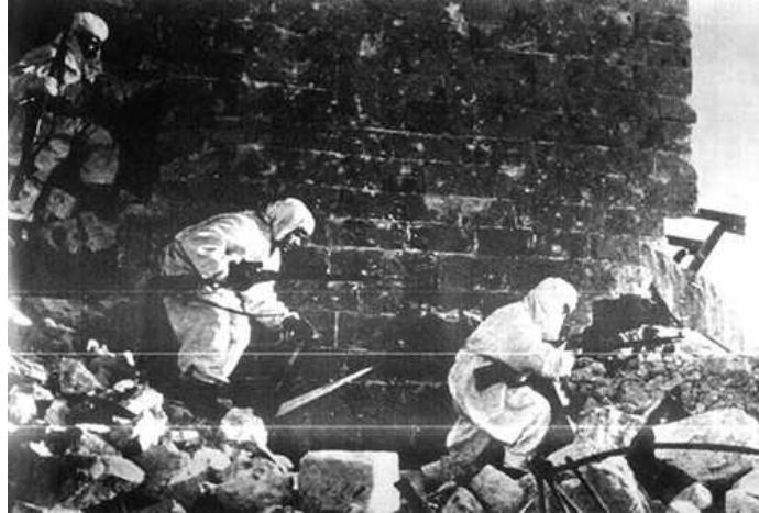
Una escena de la batalla de Stalingrado

Se producen las derrotas alemanas en África y Rusia y el desembarco aliado en Sicilia. En el pacífico los aliados toman el control de la contienda y Japón se va retirando.