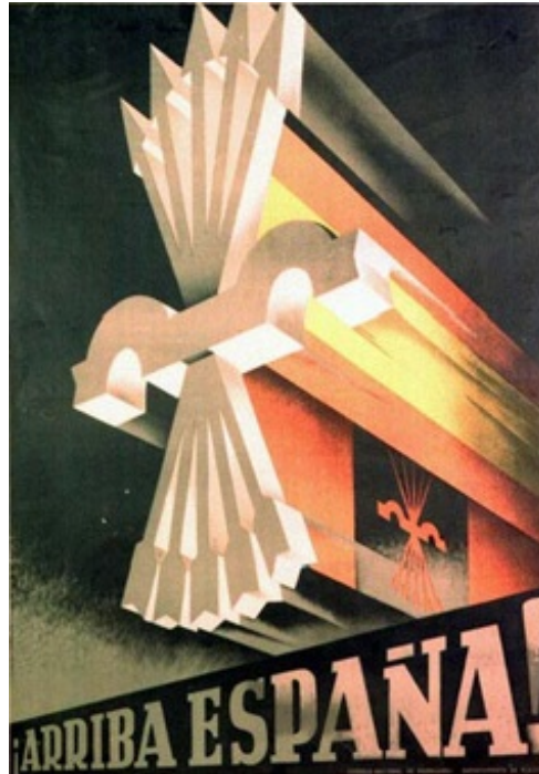
El yugo y las flechas serán los símbolos de la Falange

Antonio Primo de Rivera , que será encarcelado y ejecutado al comenzar la Guerra Civil.