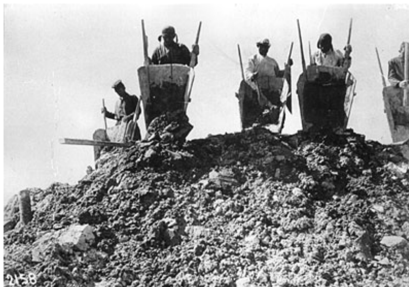
Trabajadores forzados en un campo de trabajo de Siberia

La feroz represión se extendió también al propio ejército, que quedó muy debilitado por las “purgas”, y a las nacionalidades no rusas, que sufrieron deportaciones y traslados masivos de poblaciones enteras para garantizar la “rusificación” y la pureza ideológica de grandes territorios. Como Mussolini y Hitler, Stalin utilizó una hábil y sistemática propaganda y un sistema educativo que fomentaban el culto a su persona. El arte y la cultura estaban totalmente sometidos al control del Estado, firme defensor del llamado “realismo socialista”.