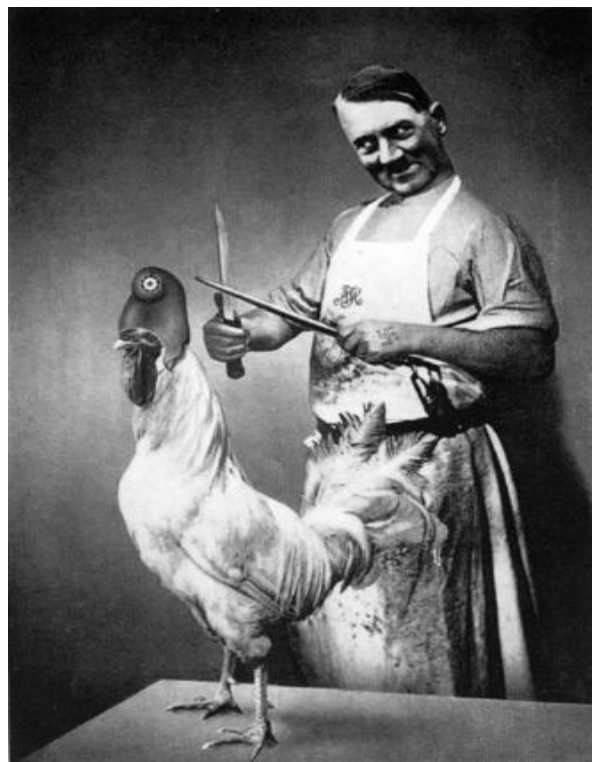
NUR KEINE ANGST – ER IST VEGETARIER

El pie de imagen dice: No temas, soy vegetariano. Fotomontaje de J. Heartfield sobre el peligro de Hitler, que como el que no quiere la cosa, amenaza a Francia (el gallo es el símbolo nacional francés)