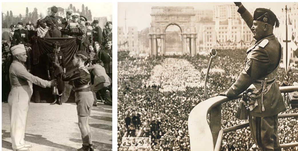
El Duce en diversos actos públicos

Poco a poco va transformando el Estado y haciéndolo cada vez más totalitario: manipula la ley para poder ganar las elecciones de 1924 y asesina al diputado Mateotti , disolviendo las Cortes a continuación. En 1925 se institucionaliza el Partido Único y promulga la Leyes Fascistísimas que totalitarizan definitivamente el Estado, comenzando el culto a la personalidad del Duce. La economía se rige por el corporativismo, consistente en la reunión de patronos y trabajadores en una misma corporación, esto, obviamente, enriquecerá a los primeros. Las relaciones patronos-obreros, establecidas mediante la Carta del Lavoro de 1927 están marcadas por el paternalismo. Con la Iglesia, el Estado Fascista mantendrá excelentes relaciones. La expansión por Etiopía aislará al país internacionalmente y le empujará a la autarquía. Italia se acercará cada vez más a la Alemania Nazi.