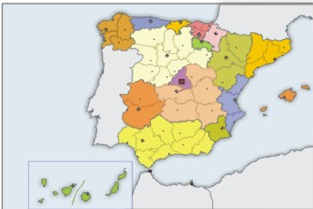
Mapa autonómico de España.