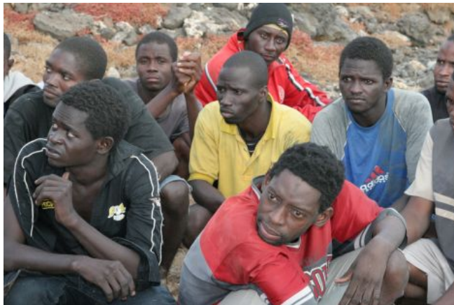
Inmigrantes recién llegados en patera a las costas españolas

La población europea, en su gran mayoría, es urbana y está afectada por el envejecimiento, las tasas de natalidad están entre las más bajas del mundo. Sin embargo, en los últimos años ha experimentado un cierto crecimiento demográfico, lo que ha provocado un rejuvenecimiento de la población debido fundamentalmente a la inmigración .