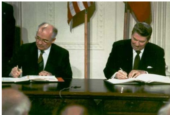
M. Gorbachov – R. Reagan, firmando acuerdo de desarme nuclear

Las reestructuración llevada a cabo por Gorbachov provocaron fuertes tensiones dentro del partido y la sociedad soviética. En 1991 fracasó un golpe militar inmovilista por falta de apoyo popular, sin embargo, se inició un proceso revolucionario que culminaría con la dimisión de Gorbachov y la llegada al poder de Boris Yeltsin, partidario de la independencia de las repúblicas. Gorbachov como fórmula para mantener la unidad sustituyó la URSS por una comunidad de Estados Independientes (CEI) por las que las antiguas repúblicas mantendrían en común solamente la política exterior y de defensa militar pero poseerían plena autonomía.