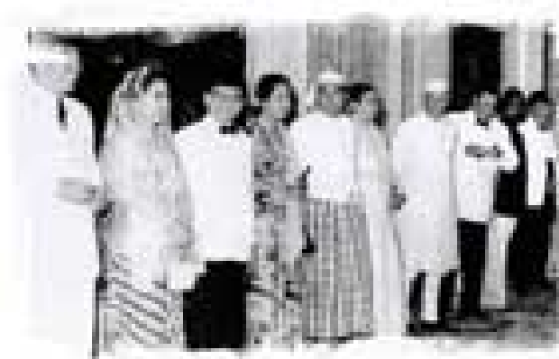
Asistentes a la Conferencia de Bandung

La descolonización fue el proceso por el que las colonias, que los países europeos habían establecido en Asia y África entre los siglos XVIII y comienzos del XX, decidieron independizarse de sus metrópolis entre 1945 y 1965. Este proceso fue muy complejo por la gran diversidad de territorios y culturas implicadas, y por los distintos modelos de colonización y diferentes actitudes de las metrópolis ante los intentos de independencia de sus antiguos territorios, afectando a más de la mitad de la superficie terrestre y a unos 1500 millones de personas repartidas por más de medio centenar de países.