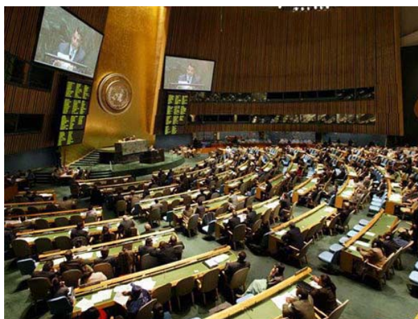
Asamblea General de la ONU

Uno de los objetivos principales de la Organización de Naciones Unidas (ONU), es velar por la paz, la seguridad y el progreso de las naciones, amparar la libre determinación de los pueblos, defender los derechos humanos y fomentar la cooperación entre sus estados miembros en todos los ámbitos ( económico, político, social, cultural, sanitario), ha exigido la intervención de la Organización en los conflictos armados que se han producido desde su fundación, bien actuando como mediador entre los contendientes, enviando tropas a lugares en conflicto, imponiendo sanciones a los países que hacen peligrar la paz, incluso imponiendo por la fuerza el alto el fuego, la retirada de tropas o el cese de las actividades militares.