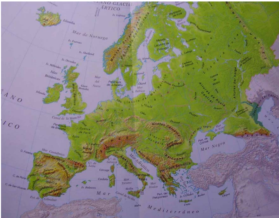
Mapa físico de Europa