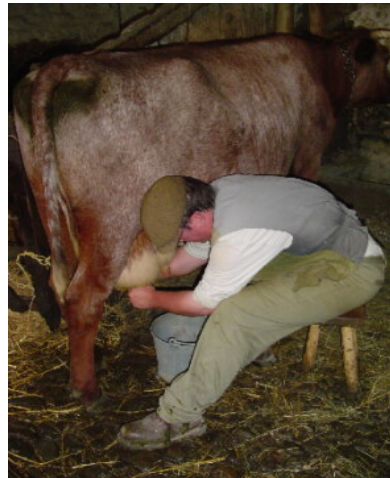
Esta imagen constituye un claro exponente del uso de las técnicas tradicionales con la misma finalidad

Te propongo escribas un texto breve, observando las fotografías incluidas, sobre las siguientes preguntas: