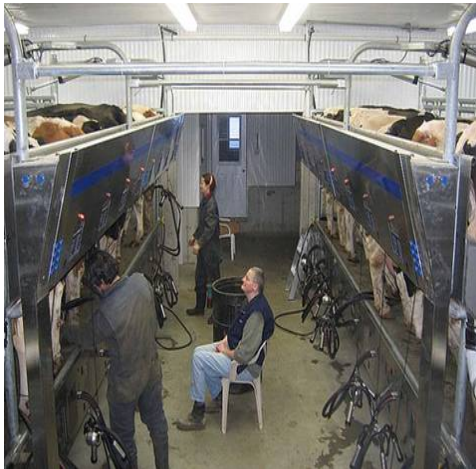
Esta imagen refleja la utilización de los avances tecnológicos en el ordeño con las máquinas