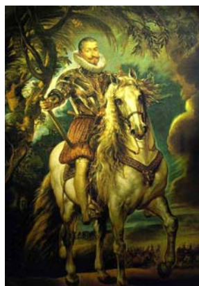
Francisco de Sandoval, duque de Lerma, pintado por Rubens.