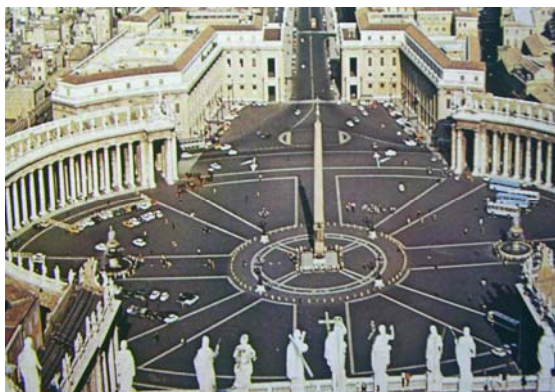
Plaza de san Pedro está realizada de forma elíptica, coronada con esculturas muy variadas. Su diseño corresponde a dos brazos que representan a la Iglesia acogiendo a cualquier humano.

Bernini diseñó la plaza de San Pedro, con una grandiosa columnata, y también efectuó el Baldaqino del interior de la basílica de San Pedro.