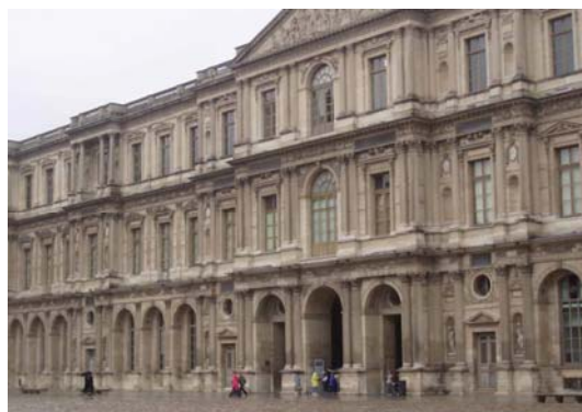
Fachada del palacio del Louvre, en la que intervino, junto con Le Vau, el arquitecto Charles Perrault.

La arquitectura francesa estuvo muy influenciada por la italiana, aunque adquirió personalidad y estilo propio, con menor decoración y mayor abundancia de la línea recta. En la arquitectura hay un predominio de los edificios civiles, al contrario que sucedió en España e Italia; de ahí la denominación de arquitectura palaciega. Dos de los principales arquitectos fueron Louis Le Vau, que realizó la fachada del Lovre, y Jules Hardouin-Mansart, autor del proyecto de la iglesia de los Inválidos. El palacio de Versalles representa al poder absoluto de Luis XIV, con inmensos jardines diseñados como un conjunto arquitectónico más.