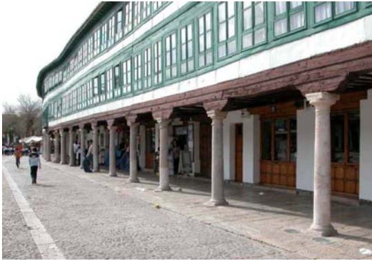
Plaza mayor de Almagro