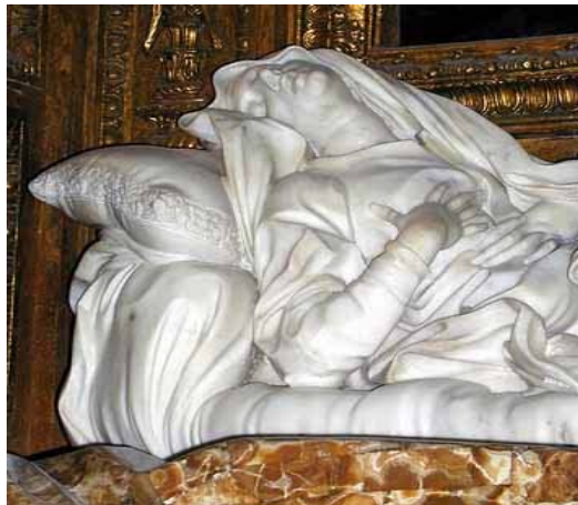
En esta estatua yacente de la beata Ludovica Alberoni, Bernini quiso evidenciar el dolor del sufrimiento pero también el gozo de una eternidad vislumbrada. Entre ambas obras existen muchísimas similitudes en la posición de éxtasis

La escultura en Francia contó con un buen plantel de artistas, aunque el más sobresaliente fue Francois Girardon que realizó las esculturas que decoran el palacio de Versailles, como Apolo servido por las ninfas o la tumba de cardenal Richelieu, donde quedó representado el cardenal-ministro de Luis XIV en una postura sosegada, acompañado de la Piedad y de la Doctrina Cristiana.