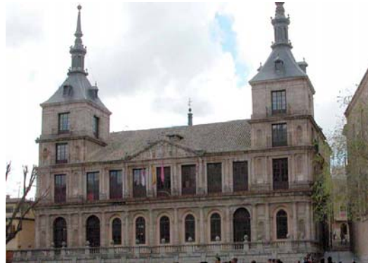
Ayuntamiento de Toledo