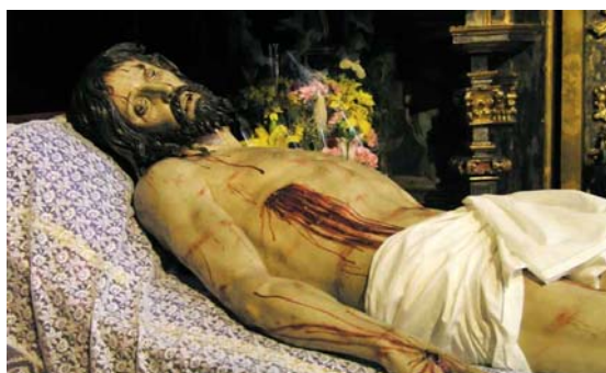
Gregorio Fernández. Cristo yacente

Gregorio Fernández es el representante del foco castellano. Su estilo fue muy realista, perfeccionista (en la anatomía de los cuerpos) y dramático, especialmente en sus Cristos yacentes. Está considerado como un gran maestro de la policromía.