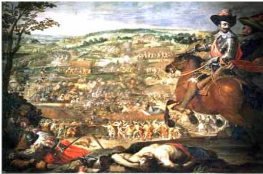
El pintor Vicente Carducho realizó varios lienzos de batallas para dejar constancia de los triunfos de las tropas españolas en la Guerra de los Treinta Años

guerra hasta tal punto que España pidió la paz, la cual se firmó en la ciudad alemana de Westfalia.