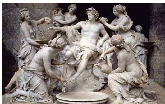
Son varias estatuas exentas de carácter mitológico, áulico y celebrativo, de composición clásica y de cierta artificialidad. El rey Luis XIV quiso que identificarse con el dios Apolo

La escultura en Francia contó con un buen plantel de artistas, aunque el más sobresaliente fue Francois Girardon que realizó las esculturas que decoran el palacio de Versailles, como Apolo servido por las ninfas o la tumba de cardenal Richelieu, donde quedó representado el cardenal-ministro de Luis XIV en una postura sosegada, acompañado de la Piedad y de la Doctrina Cristiana.