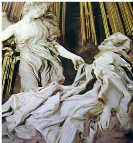
Conjunto escultórico de la familia Cornaro para su capilla en la iglesia de Santa Maria della Vittoria. Representa a santa Teresa cuando fue atravesada por el dardo del ángel

Bernini, que realizó esculturas como el éxtasis de Santa Teresa, un David y una estatua yacente de la beata Ludovica Alberoni.