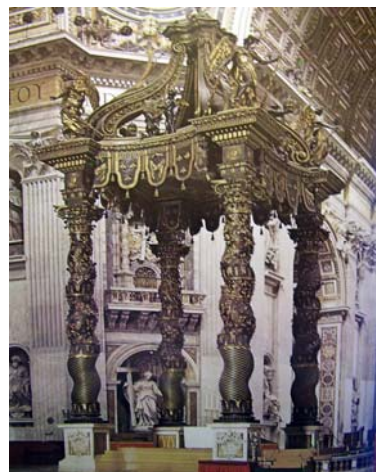
El Baldaqino se compone de cuatro columnas salomónicas realizadas en bronce, decoradas con hojas y abejas.