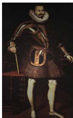
Retrato del duque de Lerma, realizado por Pantoya de la Cruz

Durante este reinado se trasladó, de manera temporal, la capital a Valladolid y se produjo la expulsión de los moriscos . Aquella salida afectó prioritariamente a los reinos de Aragón y Valencia, cuya población descendió notablemente, sobre todo en sectores como la agricultura y la artesanía.