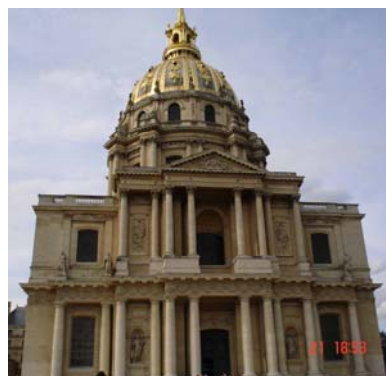
Los Inválidos es una iglesia con la cúpula muy estilizada, obra de Jules Hardouin Mansart