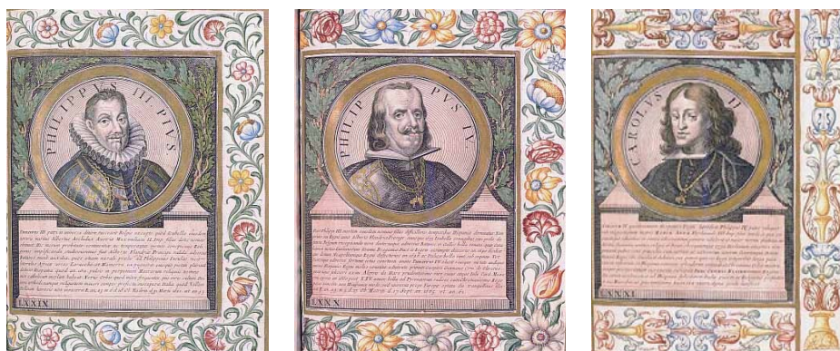
Grabados en los que aparecen representados

militares de la monarquía. La resistencia de reinos, entre ellos Portugal, Cataluña y Aragón, desencadenó una crisis política de gran envergadura.