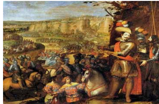
En estas dos ilustraciones quedan representadas las batallas de Eurus y Reimfelden, donde las tropas, al mando del duque de Feria, obtuvieron una importante victoria el año 1633

La paz de Westfalia produjo una serie de consecuencias. Las más importantes fueron: