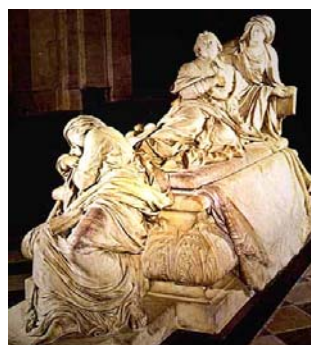
Tumba de Richelieu. Este grupo escultórico que encierra un idílico triángulo del dolor