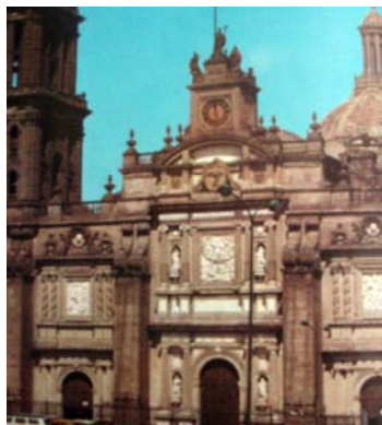
Catedral de México

La influencia en el plano artístico fue considerable. Las catedrales de México, Puebla, Guadalajara, Lima o Cuzco muestran el arraigo del Barroco en tierras americanas, al igual que sucede con algunas iglesias, entre ellas la de los jesuitas de san Martín de Tepotzotlán, uno de los ejemplos más significativos de la fantasía decorativa del barroco mexicano.