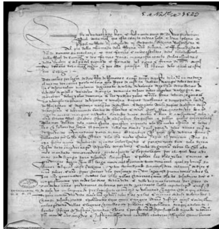
Facultad que la Corona le dio a Cortes para poblar el entonces llamado Mar del Sur