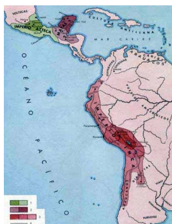
Mapa que sirve para localizar donde se ubicaban los imperios precolombinos

La organización política de las llamadas civilizaciones precolombinas era bastante perfecta ante de la conquista española. También tenían un buen nivel de desarrollo en las técnicas agrícolas, además de conocer la escritura, la astronomía y eran experimentados constructores. Practicaban un politeísmo religioso de creencias muy definidas, como que el dios transmitía el conocimiento a los humanos.