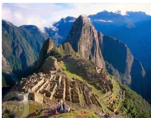
Las ruinas del Machu-Pichu. Puede hacer una visita virtual en: http://www.machupicchu.perucultural.org.pe/

Los aztecas estaban ubicados en el territorio que ocupa México en la actualidad. Formaban una confederación de diversos pueblos, gobernados por un emperador. Su capital era Tenochtitlán. La economía estaba basada en la agricultura del maíz, pimiento y tabaco. El dios más venerado fue Huitzilopochtli, identificado como el sol.