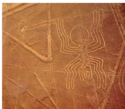
Líneas de Nazca. Imperio incaico