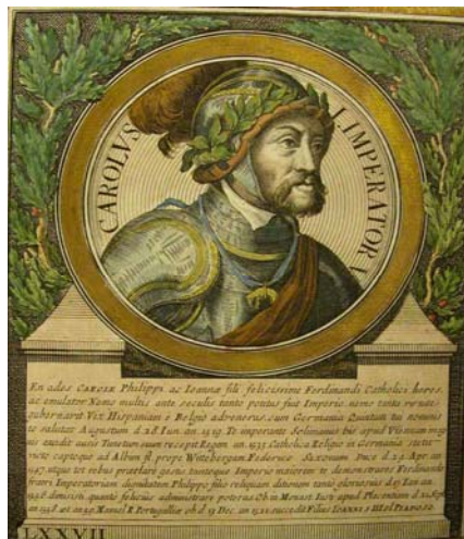
Carlos de Gante, emperador de Alemania, rey de Austria, Estiria, Carintia y Tirol, de Castilla, León, Galicia y Aragón, además de otros títulos de duque, conde, etc.

Sus abuelos paternos también dejaban un importante patrimonio territorial. Estaba compuesto por Franco Condado, Luxemburgo, Países Bajos, Austria y Tirol.