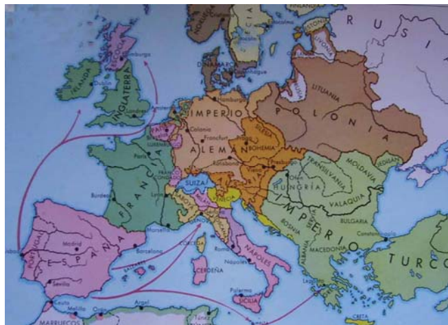
Mapa donde queda marcadas las líneas de actuación política del rey Felipe II