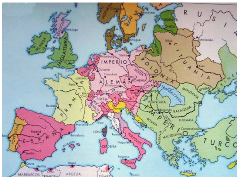
El mapa europeo durante el reinado del emperador Carlos

alianza entre el rey y la nobleza fue causa de la derrota final de los sublevados. En 1519, Carlos era nombrado emperador del Sacro Imperio Romano Germánico y su meta política fue preservar la unidad religiosa y defender la universalidad de su imperio.