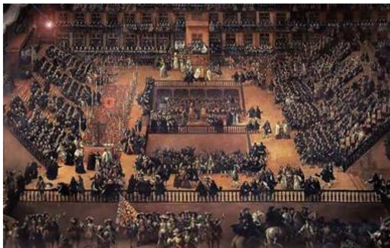
Auto de fe en Madrid el año 1660. Pintura de Francisco Ricci.