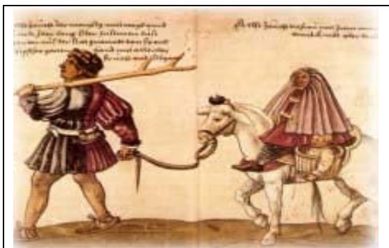
Escenas de moriscos españoles, donde son denotativas sus vestimentas.