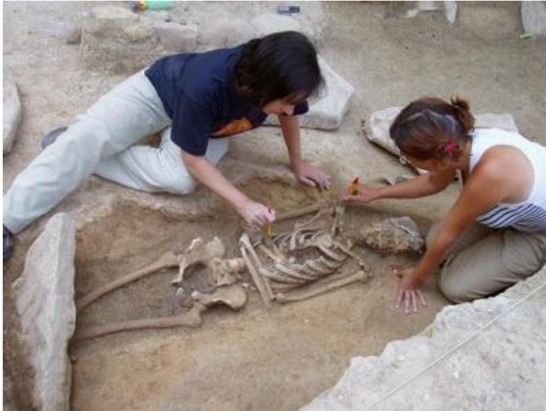
Imagen de una excavación arqueológica donde se observa su minuciosidad

urbanas se desarrollan en dos grandes focos, asociados siempre a valles fluviales: Mesopotamia, la región (hoy tan convulsa) recorrida por los ríos Tigris y Eúfrates, y Egipto, en el valle del Nilo. Además de estos focos, surgen otros, más alejados de nuestra civilización, en el valle del Indo y en China.