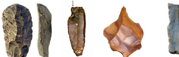
Raspador en extremo de hoja; buril sobre hoja; perforador y hojita de borde abatido

En el Magdaleniense (Paleolítico Superior) se llegan a obtener de 6 a 20 metros.