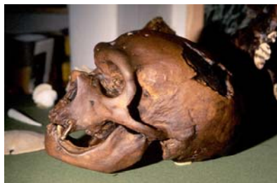
Cráneo de Homo Sapiens Neandertalensis