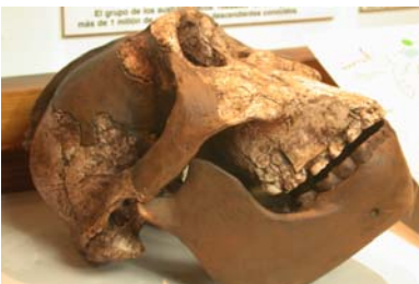
Cráneo de Australopithecus Boisei

Nosotros, Homo Sapiens Sapiens, procedemos de otro grupo que evolucionó en el África meridional y que se expandió desde allí al resto del mundo. Esto comenzó a ocurrir hacia el 120000 a.C.; llegaría a la zona de Palestina unos 30000 años después para pasar a Europa y expandirse por Asia. Los últimos continentes en conquistar serían América, por las costas del Pacífico norte (helado por entonces) y Oceanía. La característica fundamental de esta especie, que ya es la nuestra, es su oportunismo, su capacidad de adaptación a cualquier medio. Esa será la clave de su éxito.