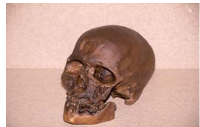
Cráneo de Homo Sapiens Sapiens