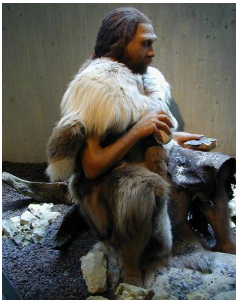
Reconstrucción de un Homo Sapiens Neanderthaliensis tallando sílex

Fuente: http://es.wikipedia.org/wiki/Hombre_de_neandertal