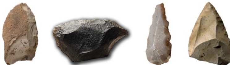
Raedera lateral, raedera transversal, denticulado y punta musterense

En el Musteriense (Paleolítico Medio) se obtiene ya 2 m. de filo útil.